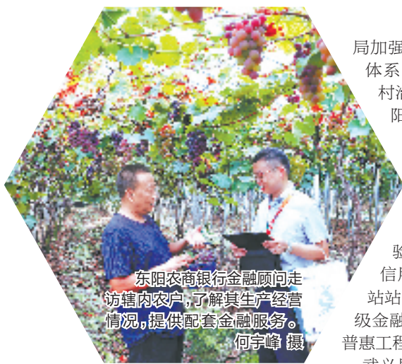
东阳农商银行金融顾问走访村内农户，了解其生产经营情况，提供配套金融服务。

普惠百业，惠及万家。近年来，国家金融监督管理总局浙江监管局围绕浙江省高质量发展建设共同富裕示范区标志性成果目标、重点工作和重大改革，精准聚焦小微企业、乡村振兴等重点领域，提升金融支持力度和服务效能，全面推进普惠金融高质量发展。金华银行业始终践行“让金融普惠大众”的初心使命，以科技为核心发展引擎，专注服务“三农”和小微企业，走稳走实普惠金融高质量发展之路。