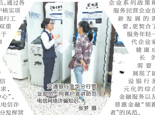
交通银行金华分行营业部员工向客户宣讲防范电信网络诈骗知识

活动响应支持小微企业系列政策和民营企业创新发展的需要，更契合了服务年轻一代企业家健康成长的需要，展现了建设银行多元化的综合金融服务以及普惠金融“领跑者”的风范。