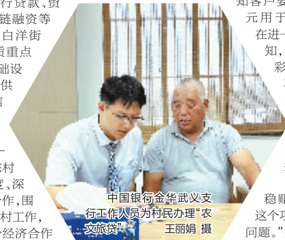
中国银行金华武义支行工作人员为村民办理“农文旅贷”

“美丽乡村E贷”是借助互联网和金融科技，优化升级后的小额农户信用贷款产品，打造个人信用评分和业务端调查核实的经营数据，整合市场监管、司法等数据，针对农户客群的小额信贷需求重塑风控模型，进一步扩大普惠金融服务边界。产品上线以来，中国银行金华市分行积极加大走