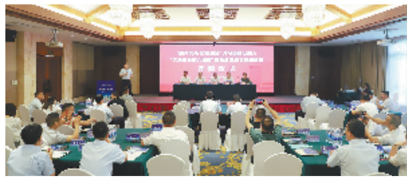
“服务义商 金智惠企”义乌市商会融入“义甬舟开放大通道”高质量发展专题研修班开班仪式

厂近期便计划大量改种绞股蓝。但万事开头难，张拯目前的种植基地面积较小，无法满足新的种植需求。为此，他每天在外走访、调研、选址，终于在新宅镇找到了合适的80亩土地及周边400平方米厂房。但是土地承包、厂房租赁已花去张拯大部分资金，购置绞股蓝幼苗与后续种植都离不开资金支持，老的药材基地也需要人工种植与看护，资金短缺的难题让他又