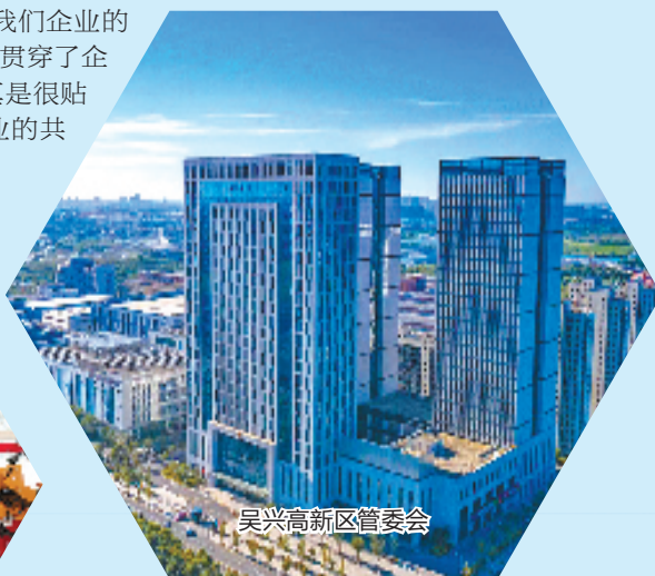
吴兴高新区管委会

服务企业,有“速度”更有“温度”。浙江奥博石英客户股份有限公司员工遇到孩子上学难的问题,高新区政务办主动服务,帮助员工办好入学手续;浙江翡翠电机有限公司入驻高新区后,面临招工难的问题,高新区立即组织开展招聘会,并帮助做好员工入职服务……“政府对我们企业的服务是全方位、多维度的,贯穿了企业生产、生活方方面面,真是很贴心。”这是落户高新区企业的共同感受。