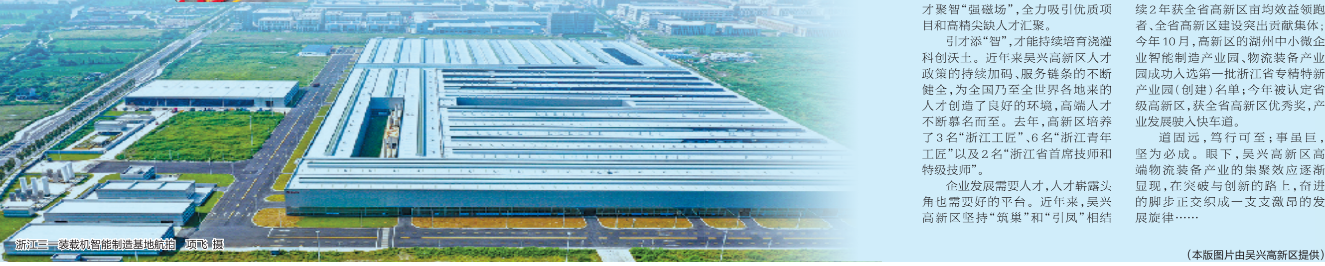
浙江三一装载机智能制造基地航拍