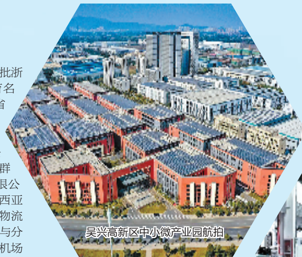
吴兴高新区中小微产业园航拍

站在新起点,吴兴高新区因科技创新的张力愈显高质量发展的定力,正加速放大创新的“乘数效应”,激活高质量发展澎湃动能。