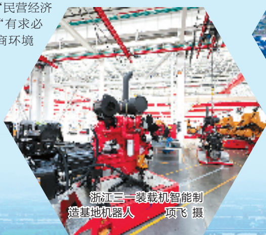
浙江三一装载机智能制造基地机器人

环境似水,企业如鱼,好的营商环境才能让优质企业“海阔凭鱼跃”。作为吴兴高端物流装备产业的主平台,高新区始终把打造更优营商环境作为“头等大事”,以“民营经济32条”为指导,打造“有求必应、无事不扰”的营商环境“金名片”。