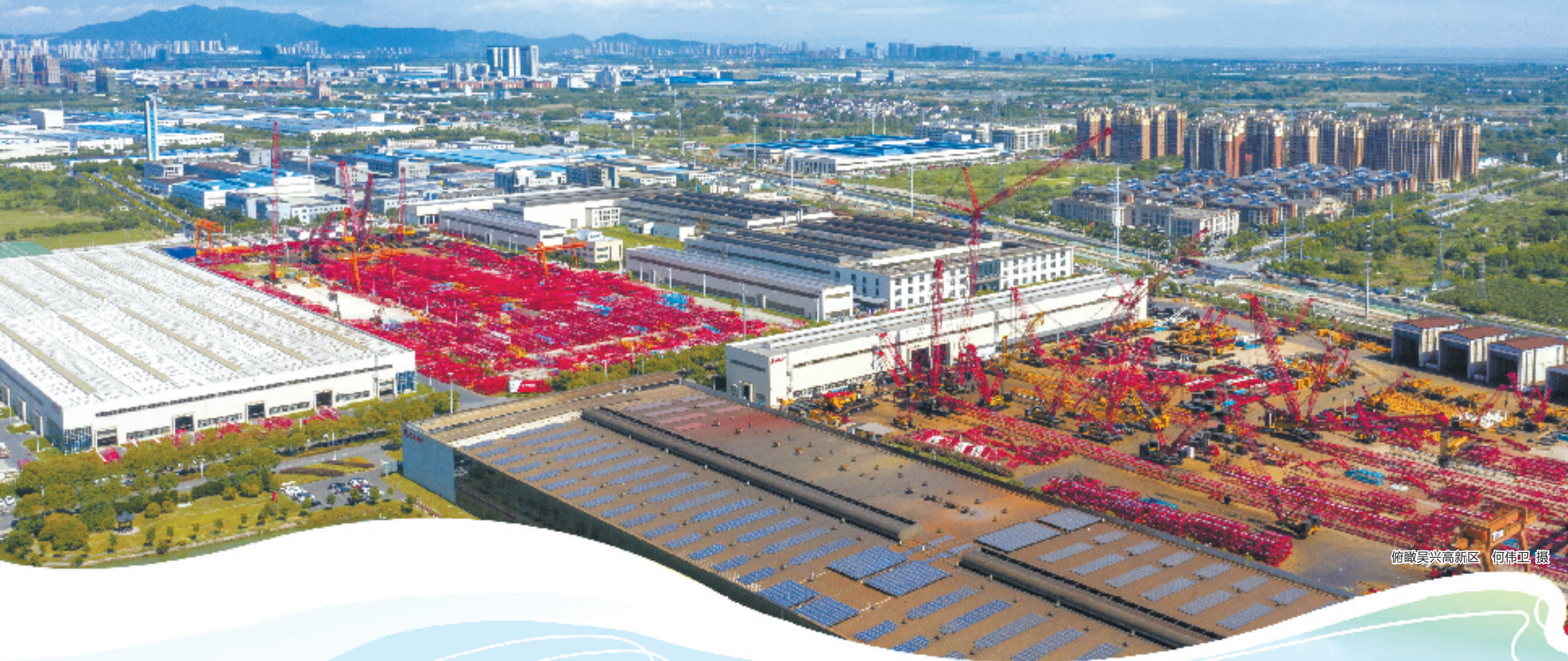
俯瞰吴兴高新区