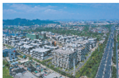
台州市恒金产业园全景

主党派市委围绕数字经济梳理形成意见建议,由各相关部门反馈落实,形成民主监督闭环体系,助推台州以数字经济为引领,进一步推动创新能级跃升、产业能级跃升、城市能级跃升。