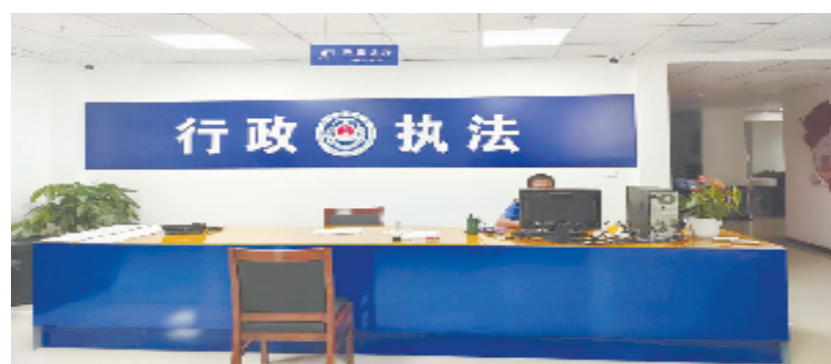
萧江综合行政执法窗口

今年以来,萧江综合行政执法窗口已办理六小企业排水证审批42件,占道审批23件,按时办结率、群众满意度均达到100%。下一步,平阳县综合行政执法局萧江中队将不断加强学习,提高业务水平,创新服务模式,破解审批过程中“时空阻隔”“多头多次跑”等问题,真正做到“小窗口,大服务,办好事”,打造群众满意的服务窗口,推进“万人双评议”工作走深走实。