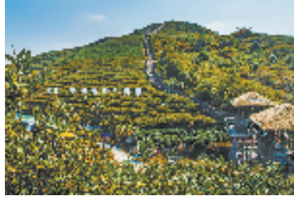
化妆品植物原料栀子花种植基地