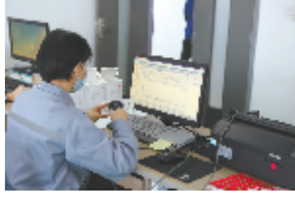
宁波推进医疗器械唯一标识实施工作