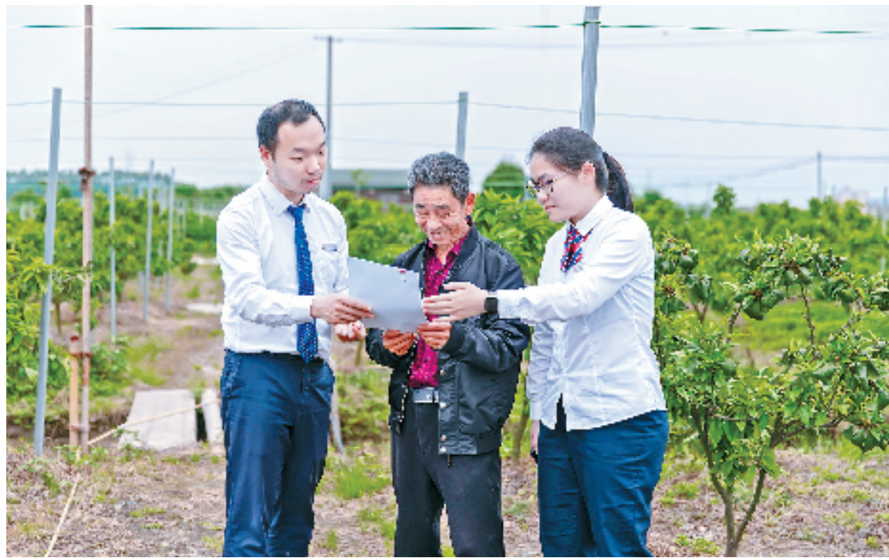
工行工作人员将金融服务送到田间地头

国家金融监督管理总局浙江监管局立足省域实际,围绕金融支持乡村振兴的重点领域和薄弱环节,率先建立乡村振兴“金融供给清单”,持续提升金融服务乡村振兴质效,有效推动金融扎根乡村、融入乡村。为进一步推进乡村振兴、农民共