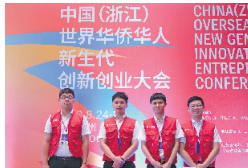
成立金融服务志愿队服务侨创会

奋楫争先,勇立潮头,启航新征程。据悉,在新一轮战略规划中,温州银行将以服务地方经济社会发展担当和使命,坚守和深化现代化城商行的战略定位,打造金融服务民生的标杆性银行、打造金融创新驱动的数字化银行、打造“农商+温银”协同发展新模式、打造助推“两个先行”的综合化银行,探索走出一条高质量可持续发展的转型路径,朝着对标优秀城商行、建设万亿资产大行的战略目标前进!