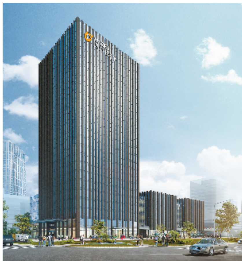
温州银行总部大楼

近年来,国家金融监督管理总局浙江监管局围绕新时代金融监管职责使命和金融高质量发展要求,引领金融机构创新产品及服务模式,完善服务渠道,持续强化“金融助力乡村振兴,共建共享富裕生活”。温州银行在浙江建设共同富裕示范区的进程中,呈现出了本土不断深耕、异地稳步发展的良好态势:杭州分行支持科技型中小企业通过“高层次人才+高价值知识产权”等无形资产获得运营资金;宁波分行首家“乡村振兴”金融服务站在宁海县南溪村挂牌;绍兴分行普惠小微贷款业务快速拓户倍增;金华分行全力支持金华市经济建设和基础设施改造;舟山分行打造海洋经济金融品牌,创新远洋渔业贷、近海捕捞贷、水产行业贷等金融产品;衢州分行认购全国首批、浙江首单绿色乡村振兴公司债券;绍兴分行推出排污权质押融资贷款,助力发展绿色循环经济……该行将全力助力浙江“两个先行”的生动实