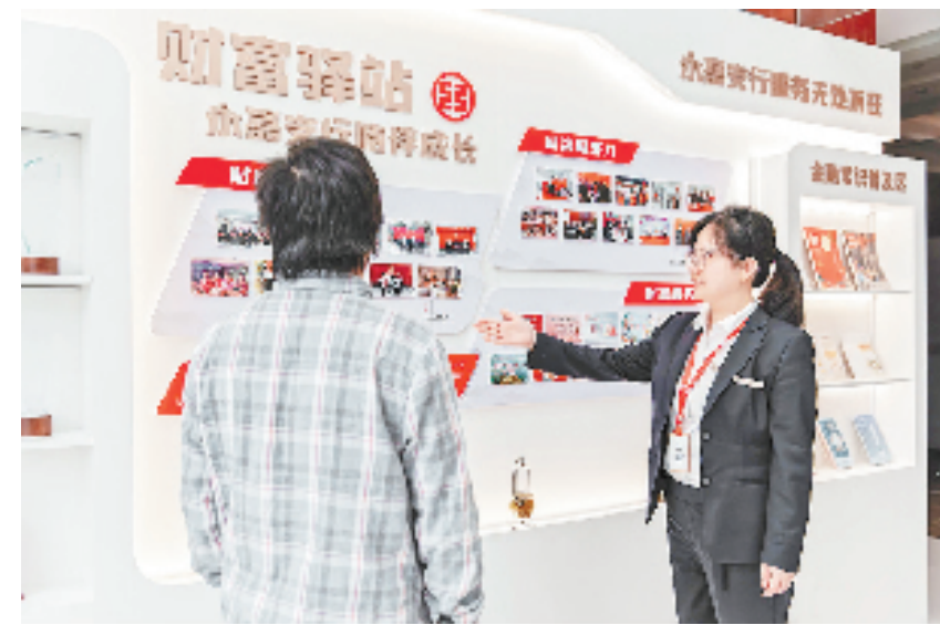
客户参观工行永嘉支行财富驿站

数据显示,截至9月,该行各项贷款总量达1856.75亿元,其中涉农贷款余额676.99亿元,较年初净增140.26亿元,以强有力的金融支持扛起逐梦共同富裕、支持乡村振兴的大行担当。