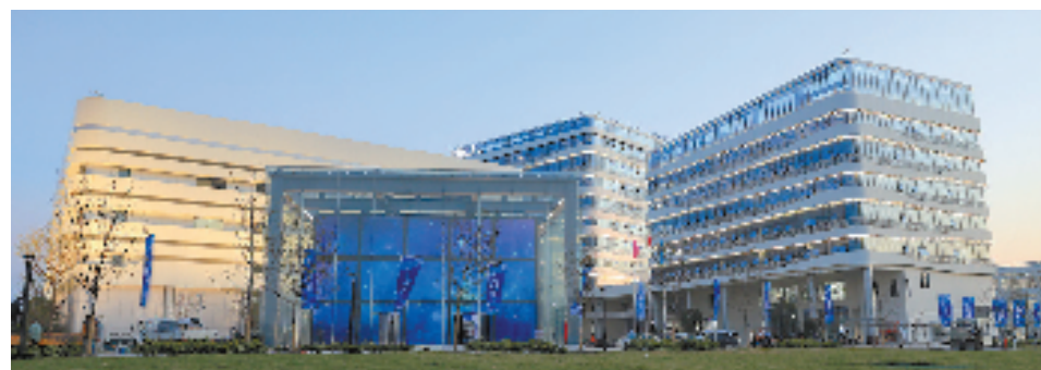
“乌镇之光”超算中心

数字之光,让小镇激荡数字经济浪潮,打开智慧生活的大门。在世界互联网大会乌镇峰会办会第十年的重要节点,桐乡聚焦打造乌镇“国际互联网小镇”的目标,既是乌镇重塑版图再出发的大胆尝试,更是不忘使命嘱托、把百姓期待变为现实的行动宣言。