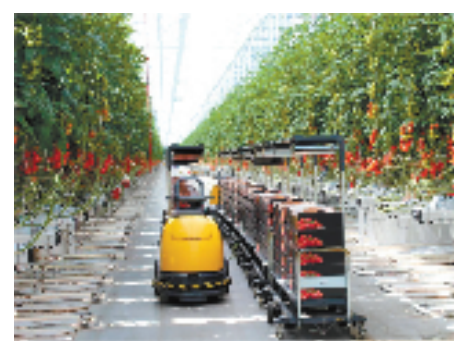
智慧农业场景无处不在

数据要素发挥的价值将在更大空间被看见。桐乡市市场监督管理局依托知识产权管理的既有体系,推进一批企业完成了数据知识产权登记,这不仅保护了企业的数据知识产权,还将帮助企业凭借数据知识产权获得质押融资,是数据资产化的全新探索。此外,桐乡入选全省第一批公共数据授权运营试点地区名单,这意味着公共数据经依法授权后,可以被加工处理开发形成更多的数据产品和服务。“这对老百姓和企业都是很大的利好消息。”桐乡市有关部门负责人分析,从守护健康桐乡的角度看,把公共数据授权给第三方开发,形成分析结果,能够精准提升医疗救助水平,最近桐乡市正携手微医集团探索健康大数据交易;再比如企业发展中的综合数据,授权给第三方开发出相关的数据要素产品,就