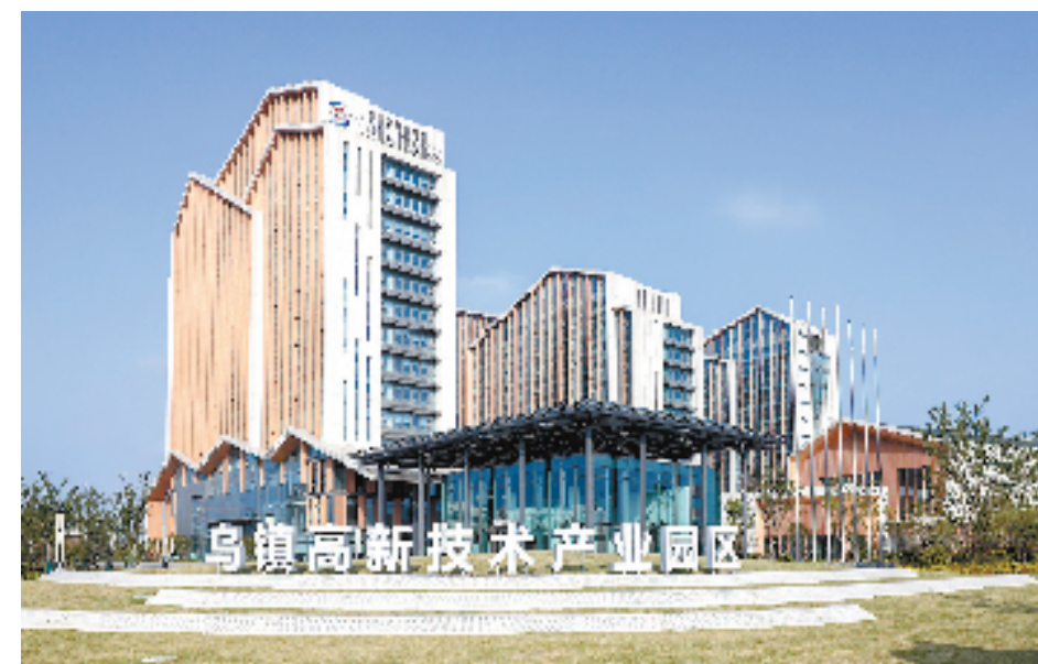
乌镇高新技术产业园区