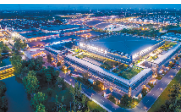
乌镇国际互联网会展中心