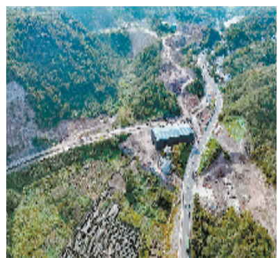
104国道新昌庄前至关岭段改建工程

打好“预防针”、系好“安全带”、立下“严规矩”,新昌交投集团以强有力的监督保障护航项目建设“大提速”。今年以来,新昌交投集团共承担实施政府投资项目13个,截至目前,已完成年度投资的92.6%。