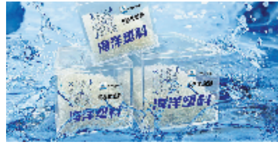
由海洋垃圾制成的塑料再生粒子配有碳足迹“追溯码”,受到国际大公司的欢迎。

“多元主体参与,市场链接产业,曾经的治理困境变成了共同富裕。”浙江省生态环境厅相关负责人说。目前,这一模式正计划向全国十多个沿海省及直辖市推广,为全球海洋塑料废弃物治理贡献中国方案。