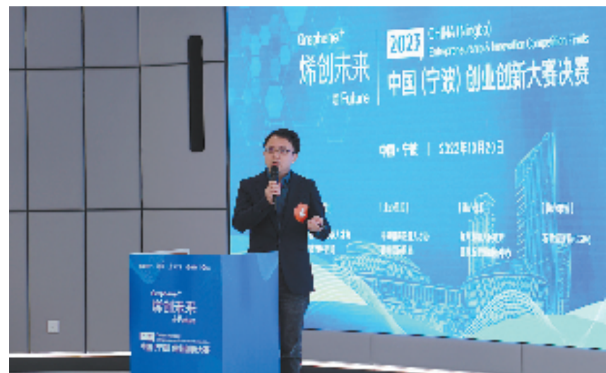
2023“科创未来”中国(宁波)创新创业大赛决赛在宁波智造创新会客厅举行