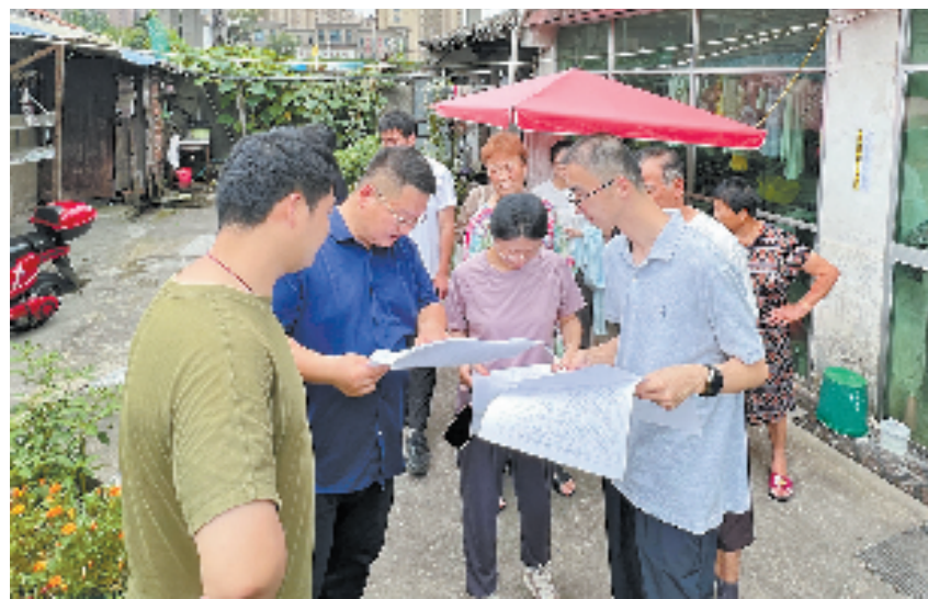
拆迁工作小组深入群众解读相关政策

项目落地,土地是关键要素。镇海土地开发强度接近50%,土地要素瓶颈突出,征地拆迁是发展的“先手棋”。