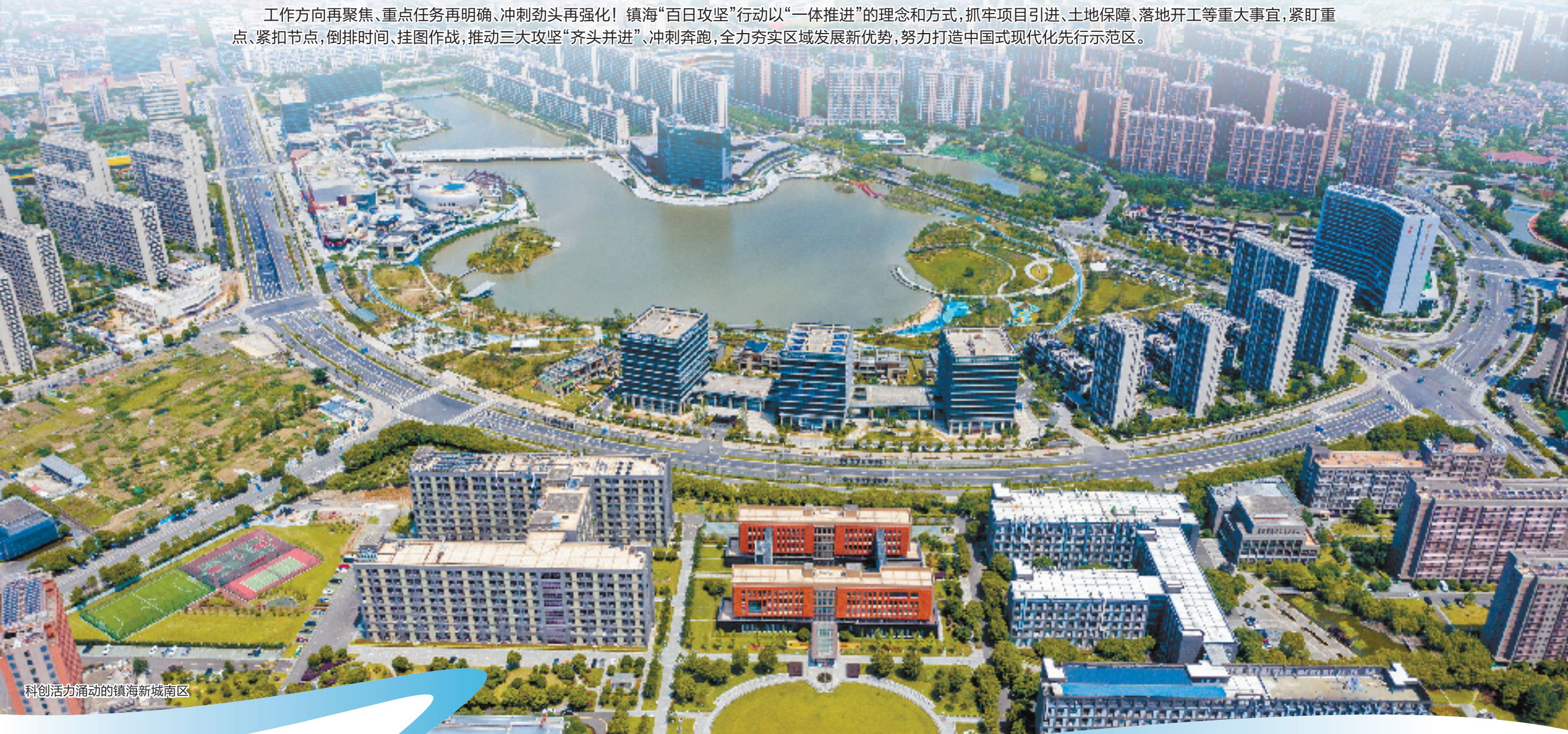
科创活力涌动的镇海新城南区

工作方向再聚焦、重点任务再明确、冲刺劲头再强化!镇海“百日攻坚”行动以“一体推进”的理念和方式,抓牢项目引进、土地保障、落地开工等重大事宜,紧盯重点、紧扣节点,倒排时间、挂图作战,推动三大攻坚“齐头并进”、冲刺奔跑,全力夯实区域发展新优势,努力打造中国式现代化先行示范区。