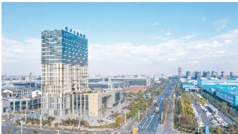
设有特种纸科技创新管理服务中心的龙游经济开发区双创综合体

不同的原材料，对生产用水的水质要求也不同。于是，龙游经济开发区投资搭建废水回用通道，在为企业降低用水成本的同时，也能有效缓解工业水厂、污水处理厂的运行压力，促进经济绿色发展。截至2022年底，园区规上工业单位增加值用水量46.1吨/万元，同比下降16.1%，工业用水重复利用率达到85%，利用非常规水1292万吨。