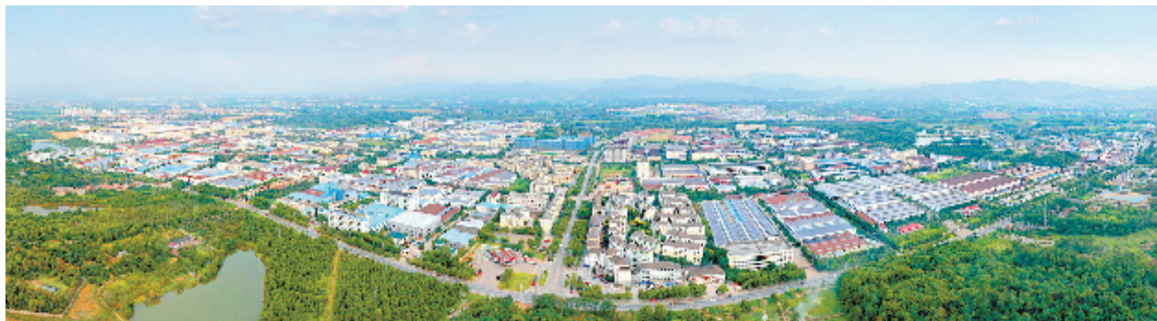
龙游经济开发区航拍全景

工业经济跑出“加速度”、城乡面貌脱胎换骨、民生福祉大幅改善……衢州市龙游县这个昔日山区小县正如一颗耀眼明珠，熠熠生辉。