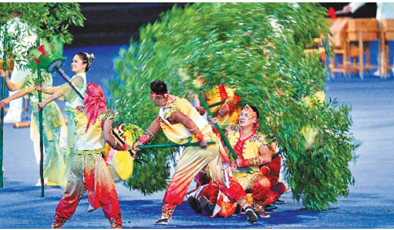
来自安吉的听障人士带来的暖场节目《竹海龙腾》。