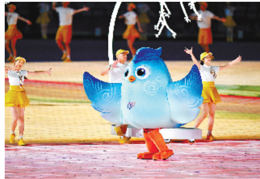
开幕式上,杭州亚残运会吉祥物“飞飞”跳跃着欢迎运动员入场。