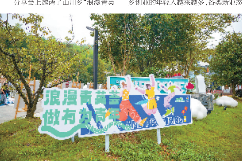
“浪漫青英荟”青春创业分享会

值得一提的是，为助残实现精准康复，南浔开发区、高新区、各镇街人大和残疾人专职委员人手一本底册，全面掌握辖区内孤独症儿童底数及康复需求数。同时，该镇人大代表紧扣宣传教育“切入点”、精准康复“基本点”、康复机构“关键点”，开展专题监督，进一步呵护残疾人身心健康。