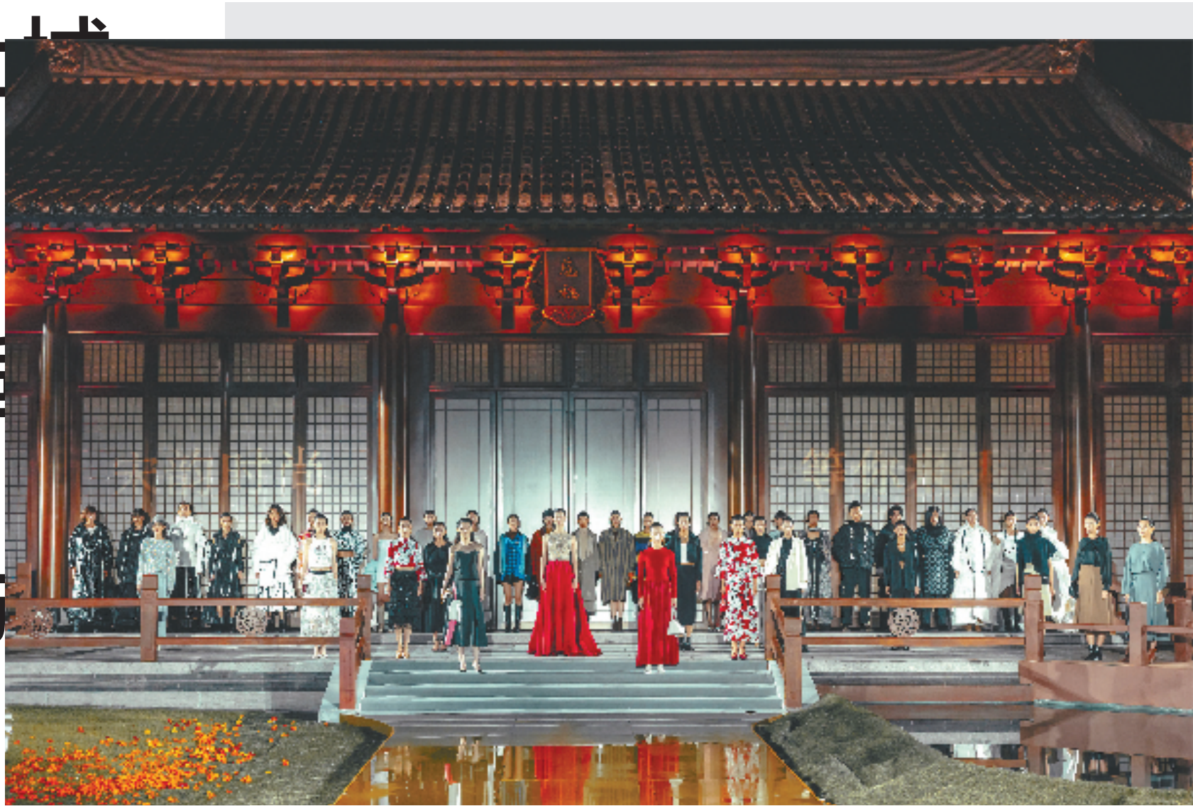
“雅致致美·潮起尚城”