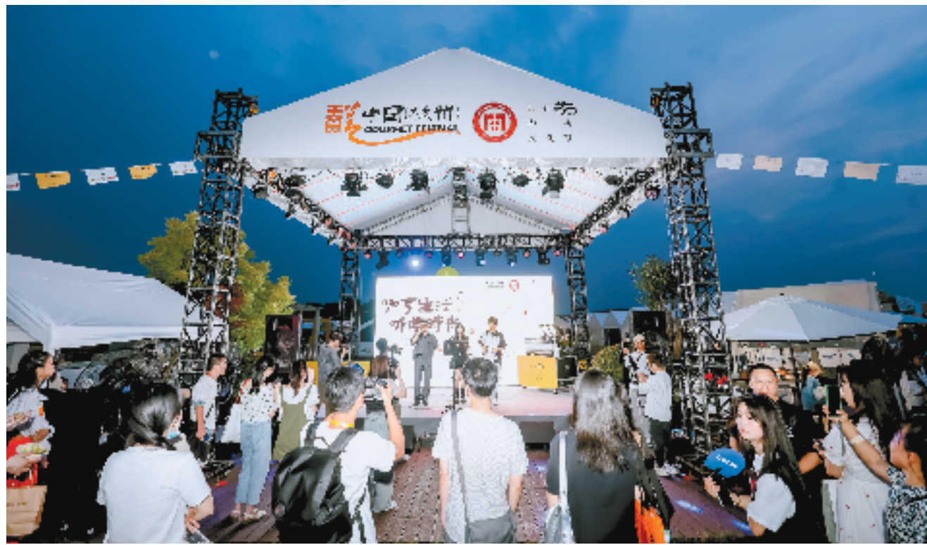
杭州(上城)国际咖啡节

本届大赛自今年4月份启动以来,历时两个月在全球范围内共征集稿件710份,作品覆盖中国、日本、加拿大、英国、韩国、挪威、泰国、印尼、西班牙和印度等国家共166所院校,最终31名国内外选手将在决赛舞台呈现他们的优秀作品。