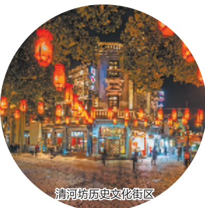
清河坊历史文化街区