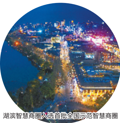
湖滨智慧商圈入选首批全国示范智慧商圈