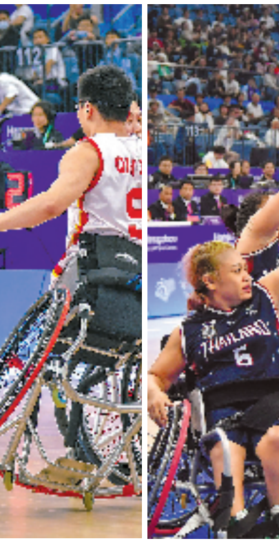
图为中国女子轮椅篮球队与泰国队比赛现场。

由于比赛对抗性强,在球员快速移动时,偶尔会出现轮椅翻倒的情况。在中国女子轮椅篮球队对泰国队的比赛中,一位泰国球员仰面摔倒,两位中国球员主动上前询问安慰,并帮忙扶起对方,生动诠释了“友谊第一”的体育精神。现场也为一幕幕爆发出热烈掌声。同样的温暖,也体现在场馆的细微处。杭州奥体中心体育馆原本高低差