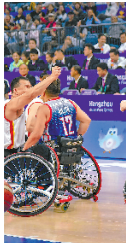
图为中国男子轮椅篮球队与菲律宾队比赛现场。

加速快攻、急停转弯、冲刺运球过人并精准投篮……如果不是亲眼所见,很难想象这是10位坐在轮椅上的运动员完成的动作。来自浙江工商大学的小李是一名篮球爱好者,这是他第一次观看轮椅篮球比赛:“感觉非常震撼!