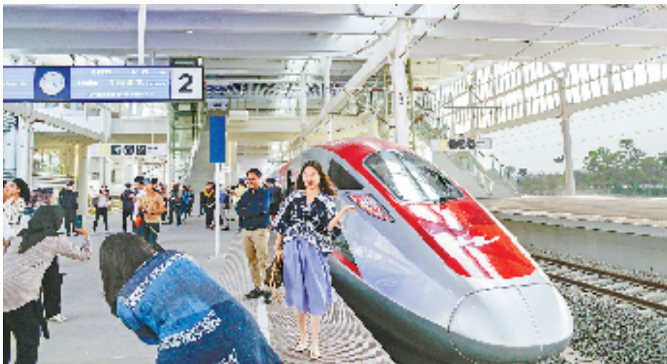
10月17日,在印度尼西亚万隆德卡鲁尔站,乘客在站台上和雅万高铁高速动车组列车合影。