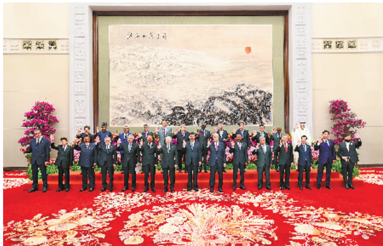
10月18日上午,国家主席习近平在北京人民大会堂出席第三届“一带一路”国际合作高峰论坛开幕式并发表题为《建设开放包容、互联互通、共同发展的世界》的主旨演讲。这是会前,习近平同出席高峰论坛的外国国家元首、政府首脑和国际组织负责人等国际贵宾集体合影。

续抵达。人民大会堂东门大厅两侧大屏幕上,共建“一带一路”项目鎏金十年硕果累累。 习近平同出席开幕式的外方领导人