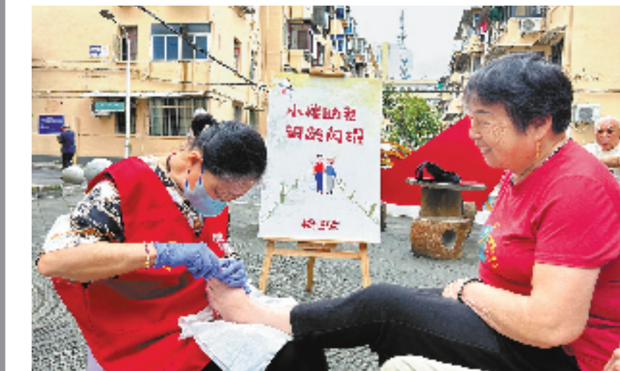
楼栋管家为居民服务

据悉,当地税务部门不断深化“便民办税春风行动”等举措,深入开展服务“专精特新”企业、省级雄鹰企业等重点企业,落实税费优惠政策,有效助力制造业转型升级。