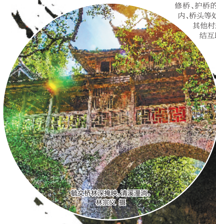
毓文桥林深掩映，清溪漫淌。