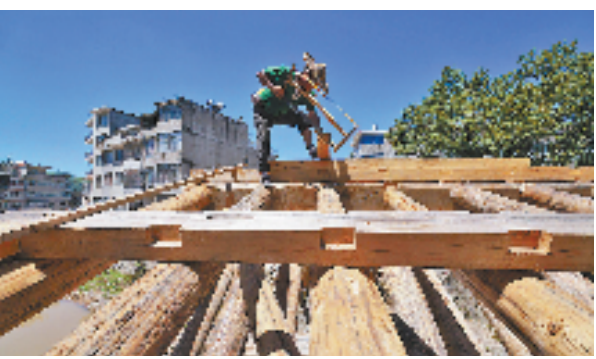
泰顺木拱桥传统营造技艺传承人呈梯队扩展