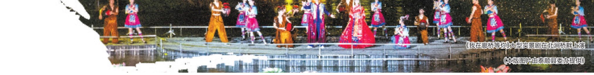
《我在廊桥等你》大型实景剧在北涧桥畔上演