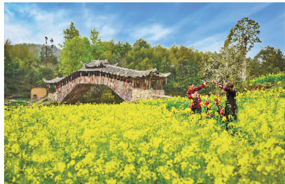
古桥与非遗的“碰撞”