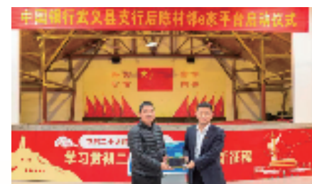
中行武义县支行后陈村邻里e家平台启动仪式

磐安抽水蓄能电站是金华市首座抽水蓄能电站，被列入国家发展战略规划的重大建设项目，每年节约发电标煤11.23万吨，可减少排放二氧化碳约22.46万吨，有效提高受电区的环境质量，中行金华市分行高效为该项目的批复30亿元授信总量，并为其提供专项优惠贷款支持。截至9月底，中国银行金华市分行实现绿色贷款余额188.9亿元，较年初增加85.56亿元，增幅82.79%。