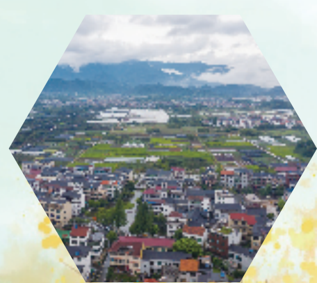
俯瞰金东区曹宅镇雅里村

2017年，金东区曹宅镇杜宅村获得“全国文明村”的殊荣。此后，杜宅村始终紧紧依托“文明有礼”基本单元建设，做深做实、突出特色，组建“1+N”队伍，实行