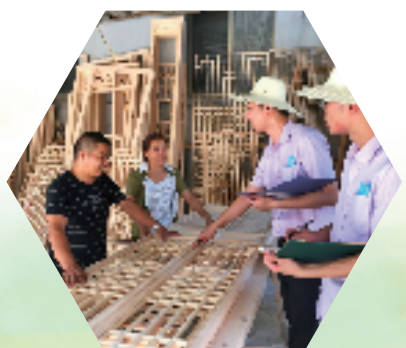
农行客户经理向村民了解仿古木雕产品信息