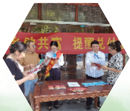
工行金华分行积极开展送国债下乡