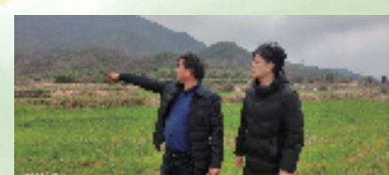
建行金华东阳支行员工实地走访农户