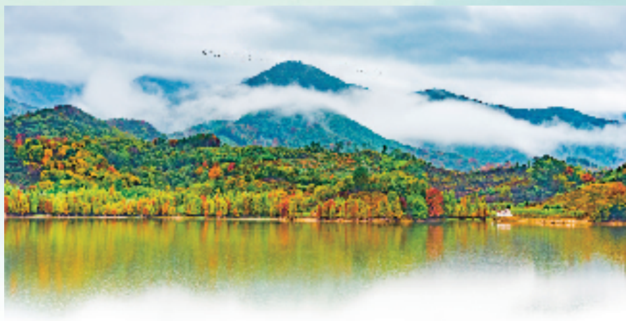
金东区曹宅镇麻堰水库

水清气润襟怀，路平灯明迎人来。白墙黛瓦倚翠微，花木有情手自栽。11个精品村，9个示范村，2条浙江省级美丽风景线……在浙江“千万工程”实施20年间，金华市金东区曹宅镇深耕美丽生态、美丽经济、美好生活的有机融合，在和美乡村建设、工农业发展、社会民生保障三方面取得了亮眼成绩，为“千万工程”增添了生动注脚，不断谱写环境优美、迈向共富、群众幸福的乡村振兴新篇章。