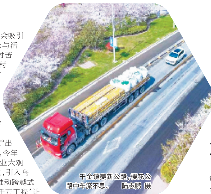
千金镇菱新公路，樱花公路中车流不息。

田园风光好，满眼皆新景。这些乡村的变迁，正是南浔以“千万工程”为引领、建设美丽乡村的缩影，也是南浔坚持生态文明理念，以绿色发展推动乡村振兴的生动实践。在推进