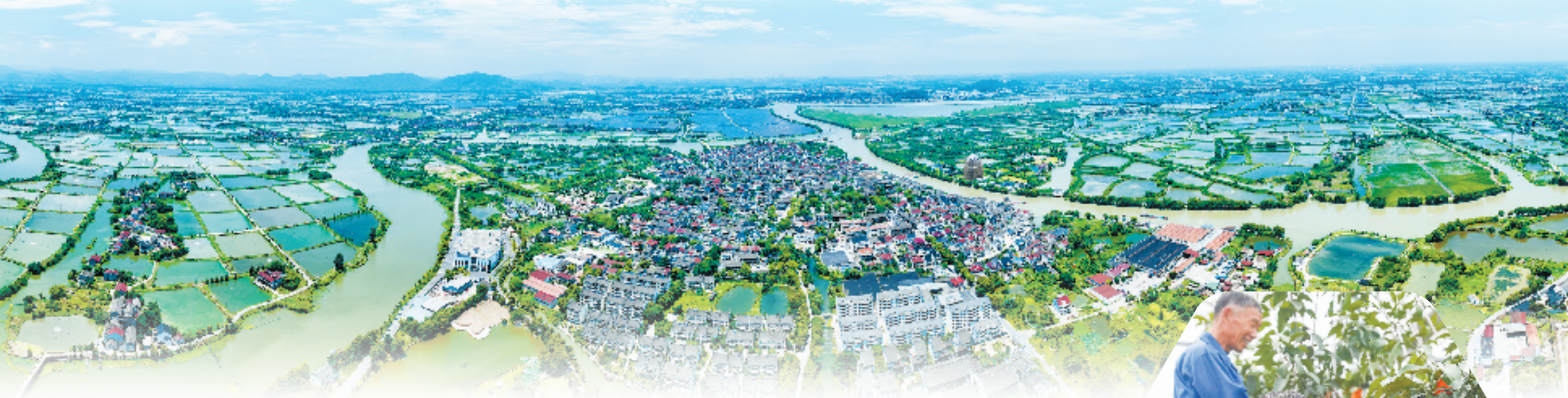
俯瞰桑基鱼塘

金秋十月，让我们走进这座拥有千年文脉的江南水乡，看这里的乡村，如何将“诗与远方”融合，让远道而来的客人乐在景里、游在诗里。