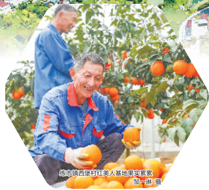
练市镇西堡村红美人基地果实累累