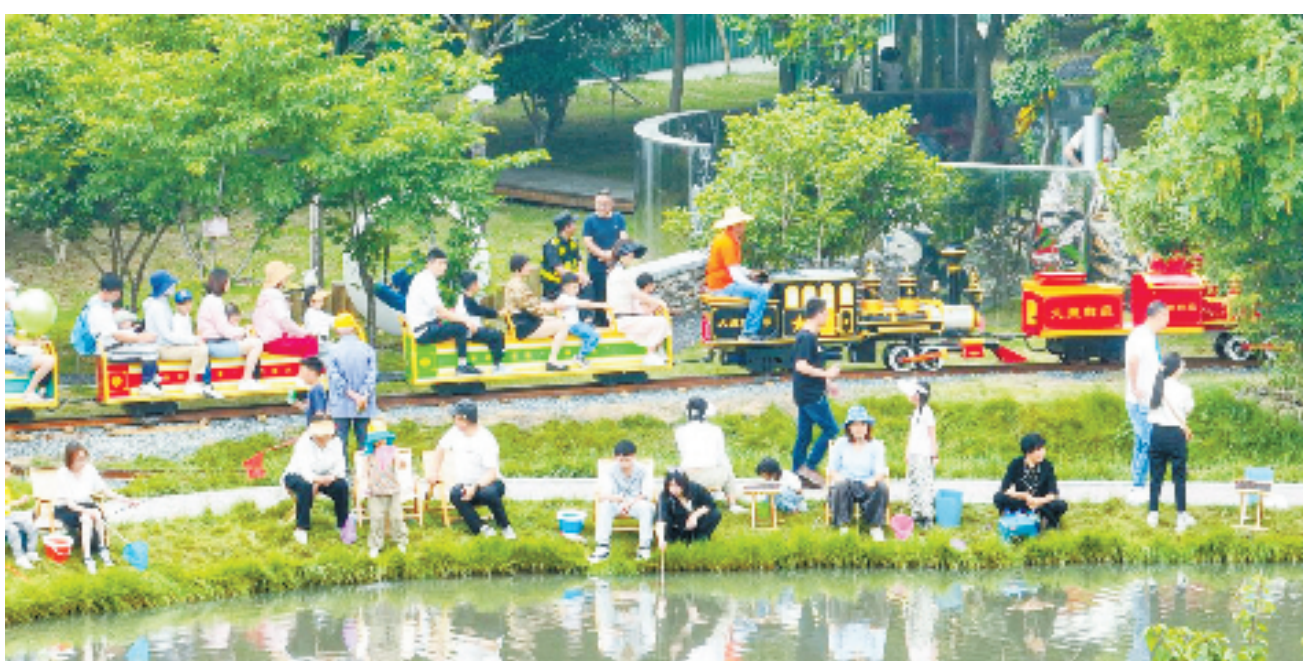
菱湖镇首届范蠡渔文化节，游人如织。

“我们推动农业产业链向上下游延伸、农文旅产业深度融合，探索差异化的乡村经营路线，不断在长三角区域内凸显城市品牌。”南浔区相关负责人介绍，而另一方面，长三角亲子乐园、长三角中央厨房、长三角农业硅谷等这些响当当的“金字招牌”，也正持续丰富南浔的乡村产业。