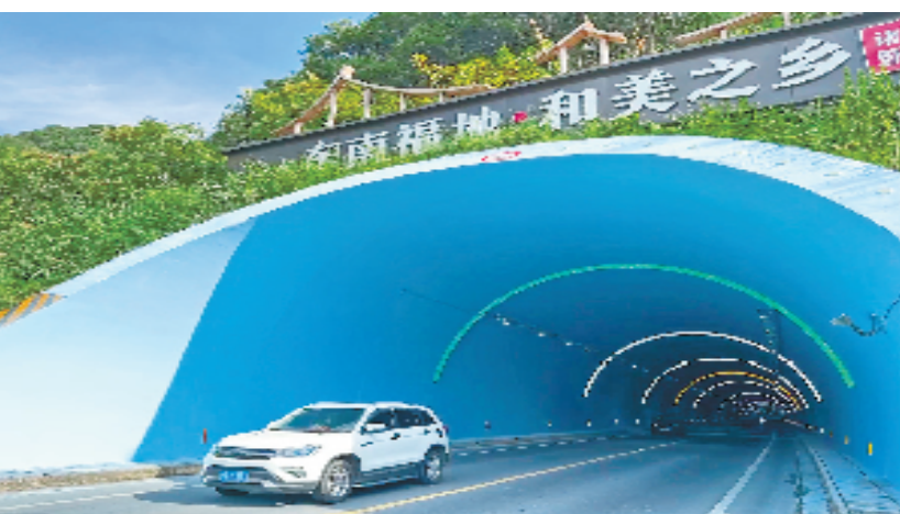
新王线木瓜岭隧道

踔厉奋进正当时。接下来,诸暨市交通局将继续推进城市品质再提升、环境面貌再优化,确保以最佳形象、最优环境为“枫桥经验”60周年纪念活动增光添彩。