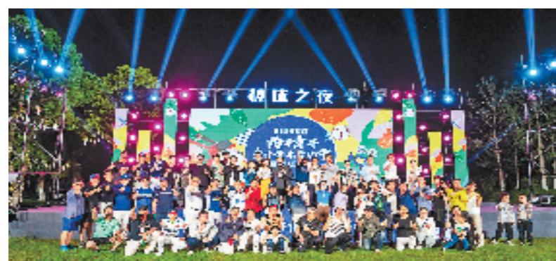
平湖林埭乡村音乐节暨棒球之夜