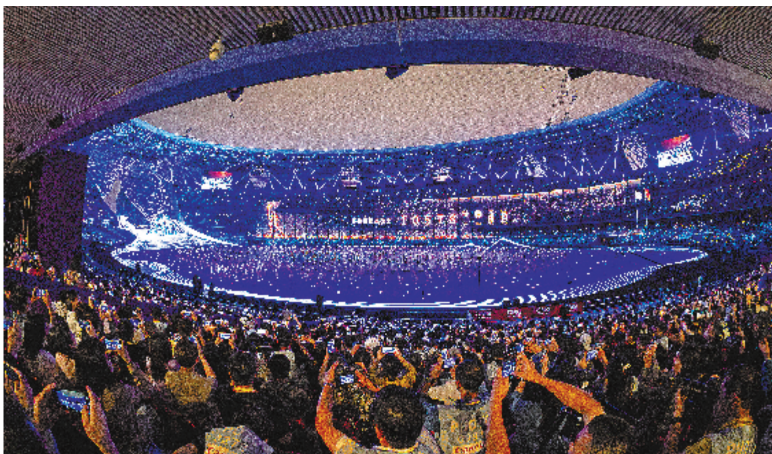
惊艳 9月23日，杭州第19届亚运会开幕式上，巨大的数字火炬手大步流星跨越钱塘江，跑进“大莲花”场内点火。

2023年 10月11日 星期三 责任编辑 金振东 版式 戚建卫 联系电话 0571 85310510 邮箱 zjrb@ 8531.cn