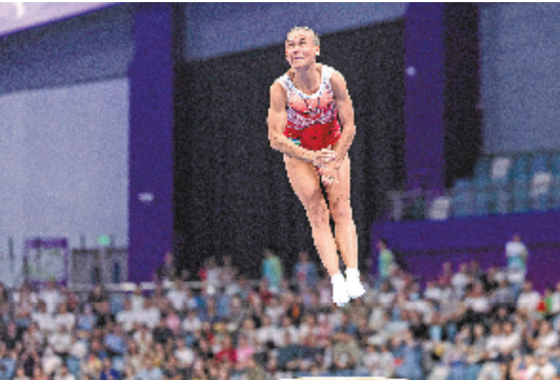
传奇 9月25日晚，杭州亚运会体操女子比赛中，48岁的乌兹别克斯坦选手丘索维金娜晋级跳马决赛。最终获第四名。