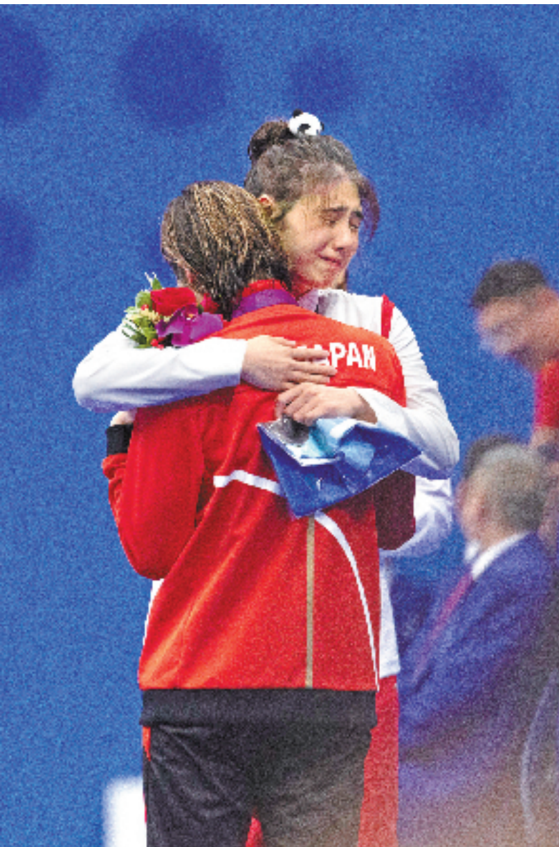
相惜 9月29日，杭州亚运会女子50米蝶泳决赛，张雨霏和日本选手池江璃花子分别获得金牌和铜牌。池江璃花子从雅加达亚运会六金到确诊白血病，积极的治疗恢复，复出，到重回亚运领奖台。颁奖仪式结束后，张雨霏和池江璃花子紧紧拥抱在一起，两个人眼中都涌出热泪。