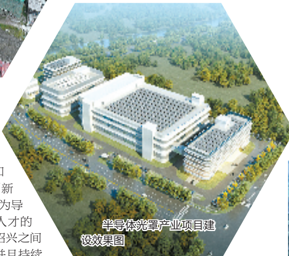
半导体光罩产业项目建设效果图

去年以来，绍兴积极创建海峡两岸(绍兴)数字产业合作区，绍兴片区将积极承接台商、台企光电产业的优势资源；相继投运中科大绍兴新材料产业研究院、哈工大柯桥创新中心、浙江树人学院柯桥科技创新中心等高能级科创平台，全速推进绍兴光电研究中心建设；深圳—杭绍光电产业交流会、武汉“中国光谷”招商推介会成功举办，引进落地高层次人才项目20个……围绕“临空智创城、杭绍光电谷”的目标愿景，绍兴片区光电信息产业项目的落地地可谓紧锣密鼓。