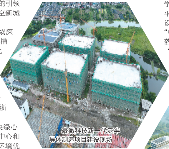
豪微科技新一代泛半导体制造项目建设现场

“一核”为临空智创城(中央绿心公园)，是绍兴片区的科创服务中心和城市综合服务中心，将打造成环境优美、设施齐全、具有区域引领性的国际人才公园；“两廊”为融杭人才科创走廊和西小江人文生态走廊；“三片”为光电信息产业片、融杭数智产业片和康养时尚产业片。其中光电信息产业片将打造国内领先的光电信息产业集群。