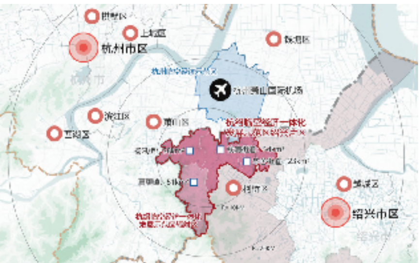
绍兴片区区位示意图

相关研究表示，在城市功能扇面和机场功能扇面重合交界的10—15公里圈层范围内，适合发展应用研发、服务配套、高端制造等“高精尖轻”新产业。而绍兴片区包含的柯桥区华舍街道、钱清街道、杨汛桥街道及辐射带动的夏履镇又是其中山水要素最多元、环境品质