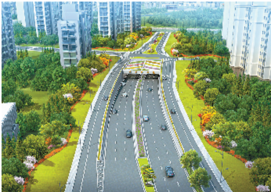
群贤路西延萧山秀路一期工程鸟瞰图

“五创图强、四进争先”，这是绍兴眼下持续推动“八八战略”走深走实的目标举措，也是绍兴勇闯中国式现代化市域实践新路子的重要抓手。找准新目标，再攀新高峰，作为绍兴全面融杭的“桥头堡”，绍兴片区将带着梦想与使命再度出发。