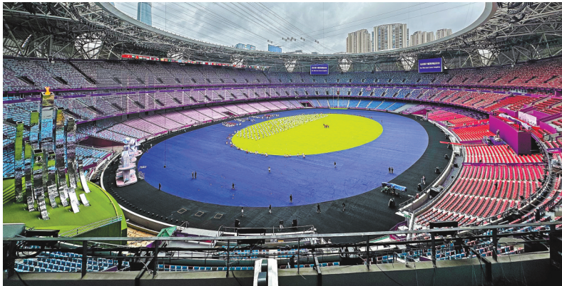
10月7日，“大莲花”完成转场。