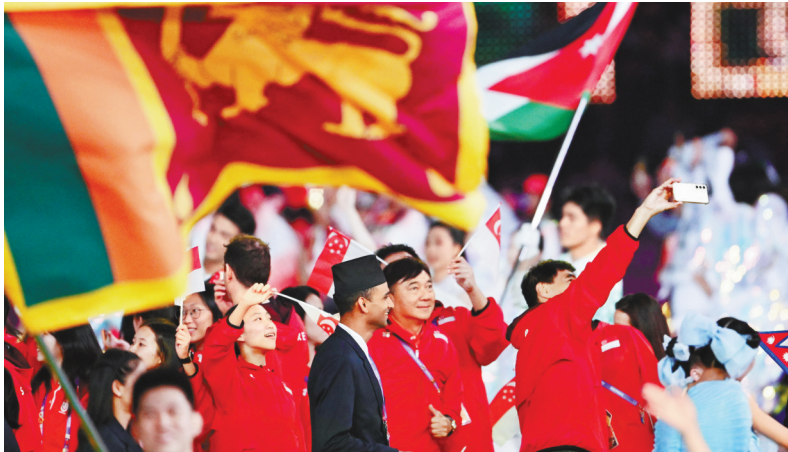
10月8日，闭幕式现场，各代表团入场后纷纷自拍留念。