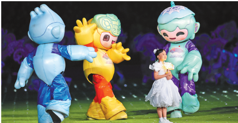
10月8日，闭幕式上，小女孩手捧一朵盛开的“花”。