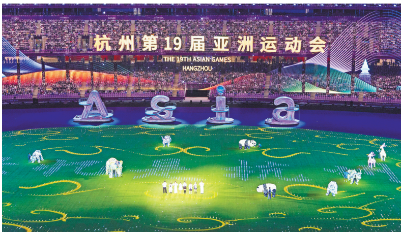
10月8日，闭幕式现场，大莲花被打造成一个“大花园”。

这块生机勃勃的草坪，是科技与生态的融合、技术与艺术的嫁接，如点点繁星勾勒出多变的影像，人们在“人与景”交互的勃勃生机中感受杭州绿水青山的生态魅力，体会亚洲“山水相连、人文相亲”的历史情谊。