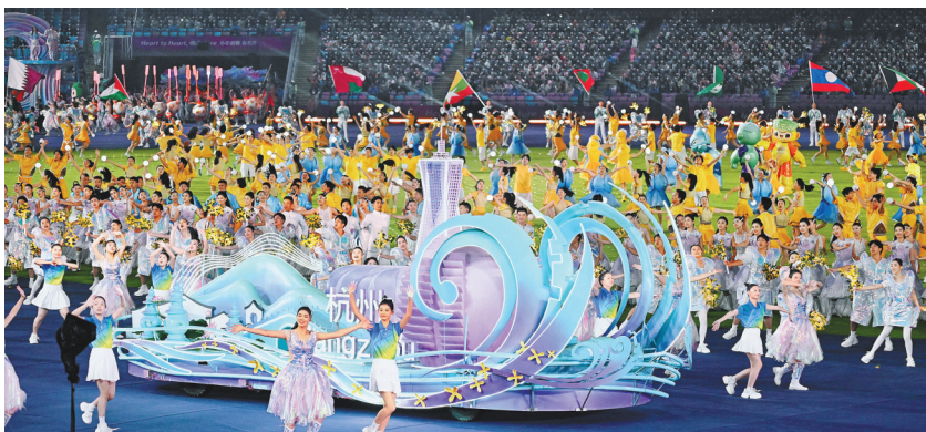
10月8日,闭幕式上,杭州、宁波、温州、湖州、绍兴、金华六个办赛城市的花车在巡游。