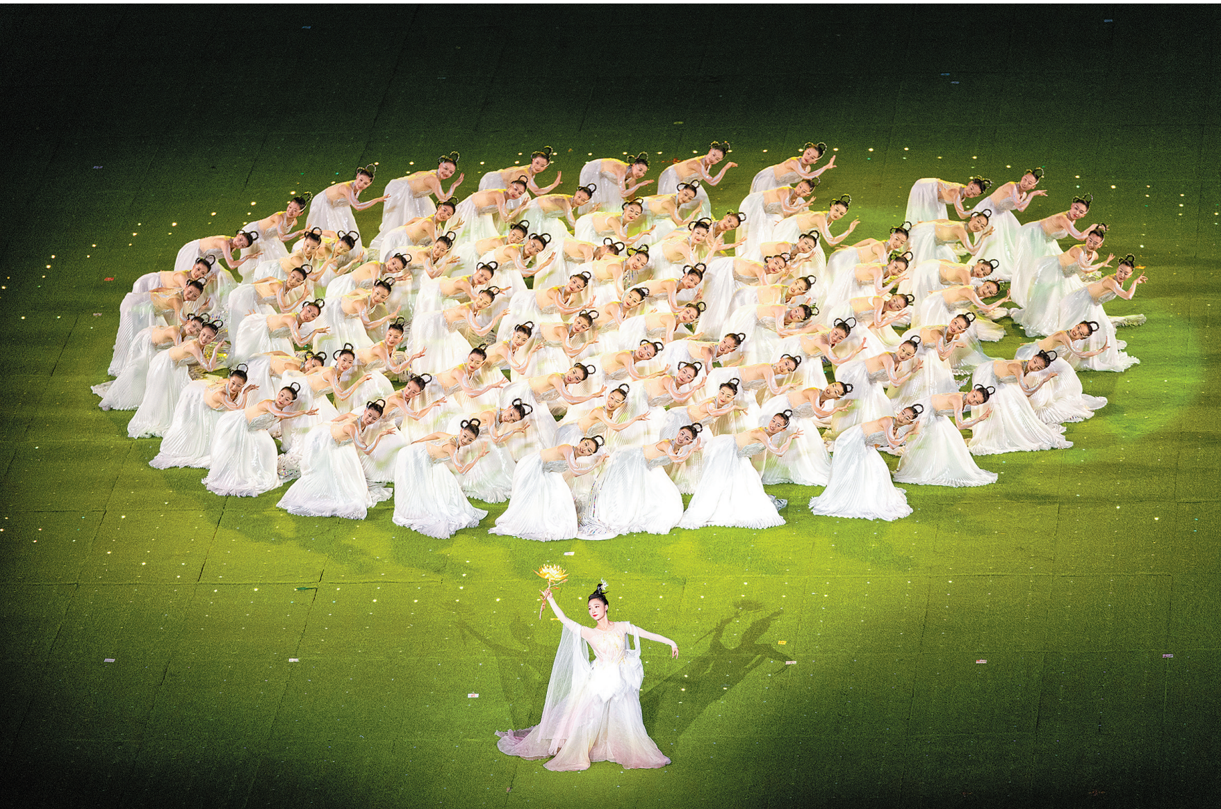
10月8日,闭幕式上,以“荷桂共生辉”演绎中国人传承千年的惜别怀远。

编者按 江南好,情难忘。10月8日晚,杭州亚运会闭幕式在杭州奥体中心体育场“大莲花”隆重举行。从期盼到相会,从重逢到告别,闭幕式以中国式的独特浪漫,与亿万观众和各国运动员依依惜别。整场闭幕式生动诠释了杭州亚运会绿色、智能、人文、简约、惠民的特色。精彩的体育盛会圆满谢幕,但钱塘江畔的亚运记忆却难以忘怀,化为一个个珍贵的瞬间,永存我们心中。