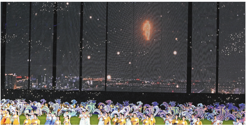
10月8日,闭幕式上,数字火炬手迈向远方。

值得一提的是,“数字火炬手”将代表杭州亚运会,送给所有人一份特别的礼物,象征着亚运精神永远传承的“亚运星光数字纪念章”。闭幕式后,网友在支付宝搜“亚运”即可领取。