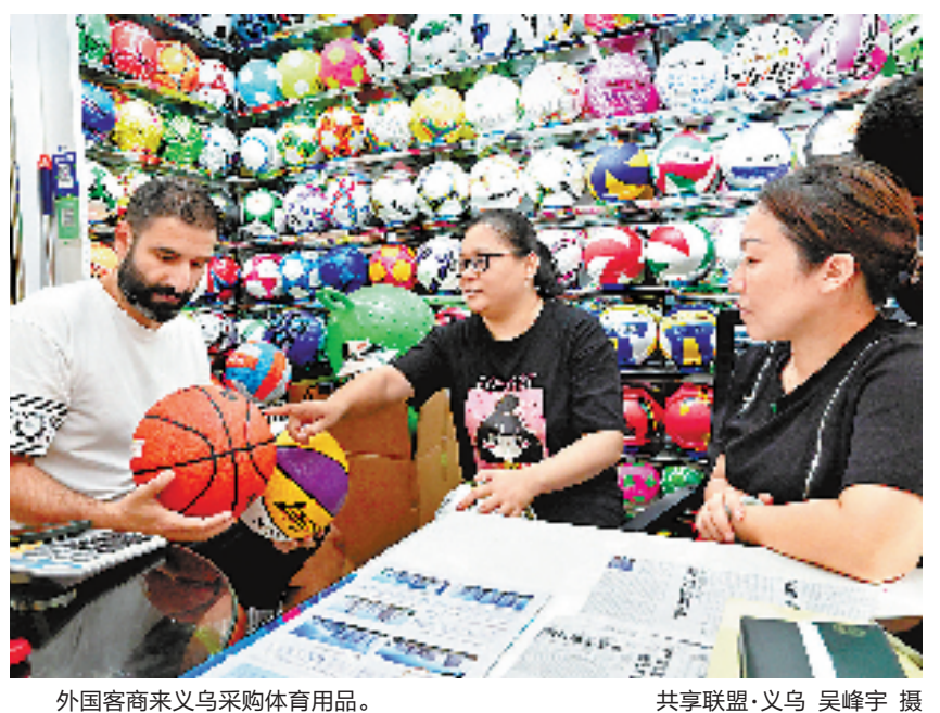
外国客商来义乌采购体育用品。

“很多观众坐得远，只能通过望远镜来看精彩瞬间。”专售望远镜的商户陈嘉佳这两天也忙到脚不沾地，一边杭州的采购商一直在询价，另一边外贸方面，亚运会带动了亚洲地区相关赛事的举办，产品订单也明显增多了。“印度、日本、韩国、马来西亚等国家的客户，多的时候，要订购上万个。”