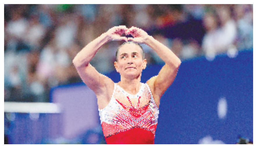
丘索维金娜在赛场上比心。