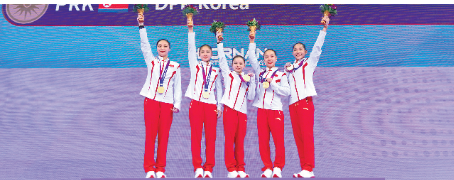
中国女子体操队连续13次登上亚运会冠军领奖台。