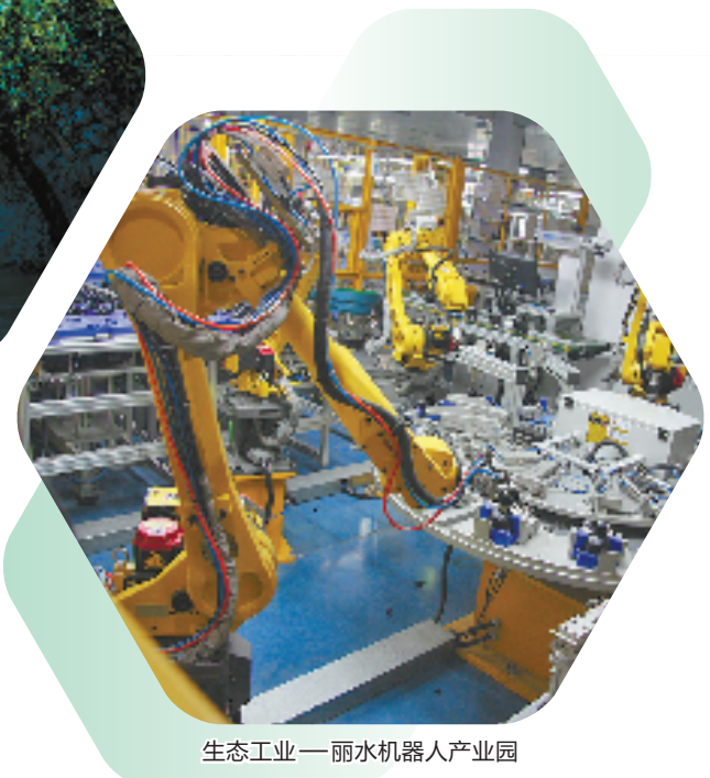
生态工业——丽水机器人产业园