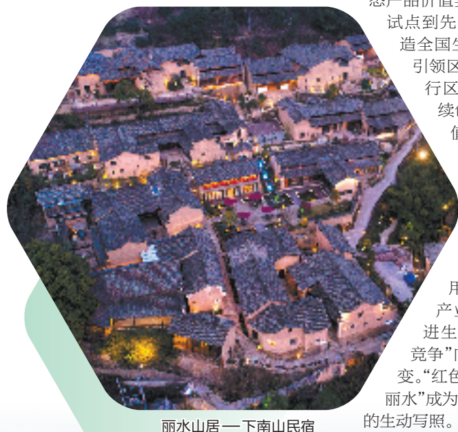
丽水山居——下山山民宿

近年来，丽水不断以改革推动构筑绿色发展优势，在全国率先开展生态产品价值实现机制从先行试点到先验示范改革，打造全国生物多样性保护引领区、中国碳中和先行区等系列改革，持续创新生态产品价值产业化、市场化实现机制，率先探索打造“丽水山耕”“丽水山居”“丽水山泉”等“山”系区域公用品牌牵引生态产业蓬勃发展，促进生态产品由“低价竞争”向“品牌竞争”转变。“红色浙西南、绿色新丽水”成为浙西南革命老区的生动写照。