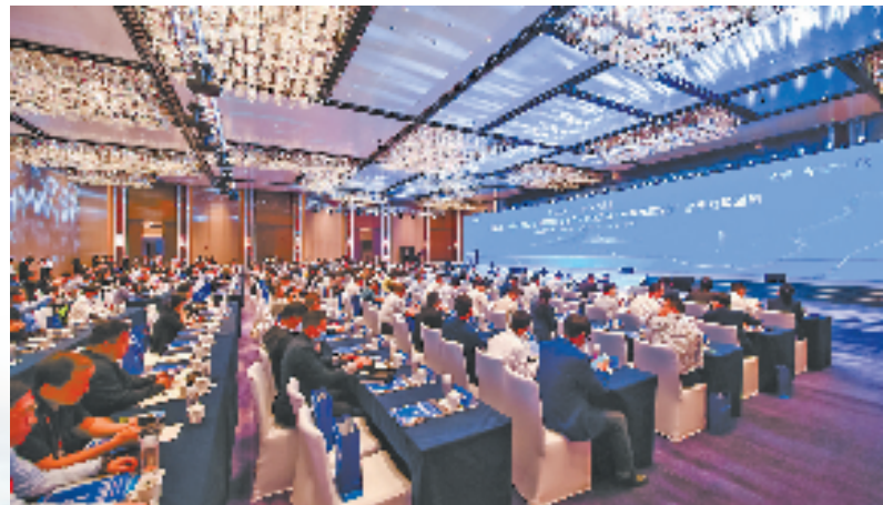
浙江省“十链百场万企”系列对接活动