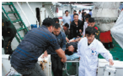
象山“海上120”紧急搜救医疗救护队执行任务中