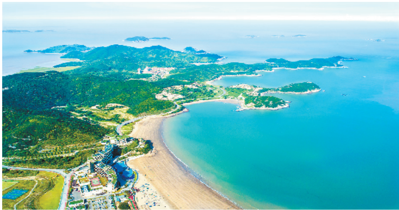
象山半边山风景区

“把健康融入所有政策”是象山建设健康县区的底气。围绕医疗服务体系、绿色环境、全民健身、健康产业，象山打造了一个县域的健康样板，助力健康浙江行动推进，让人民健康成为共同富裕的鲜明底色。