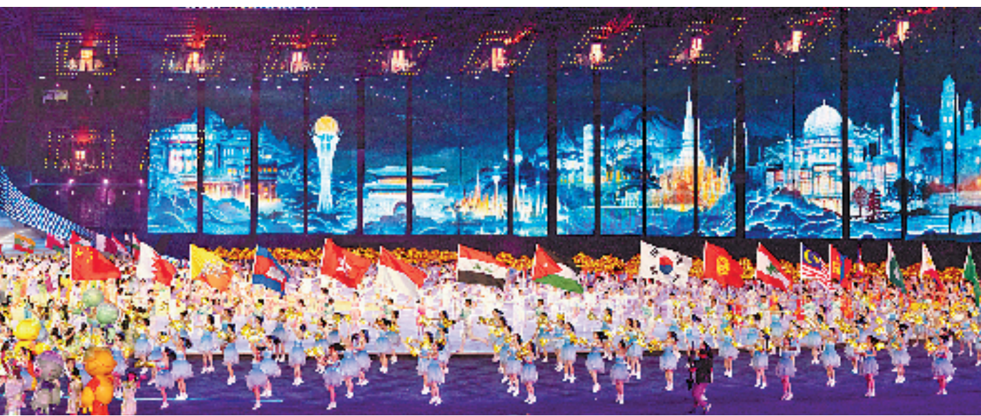
《梦想天堂》的歌声来到高潮,观众席中的“幸福之门”同时点亮。