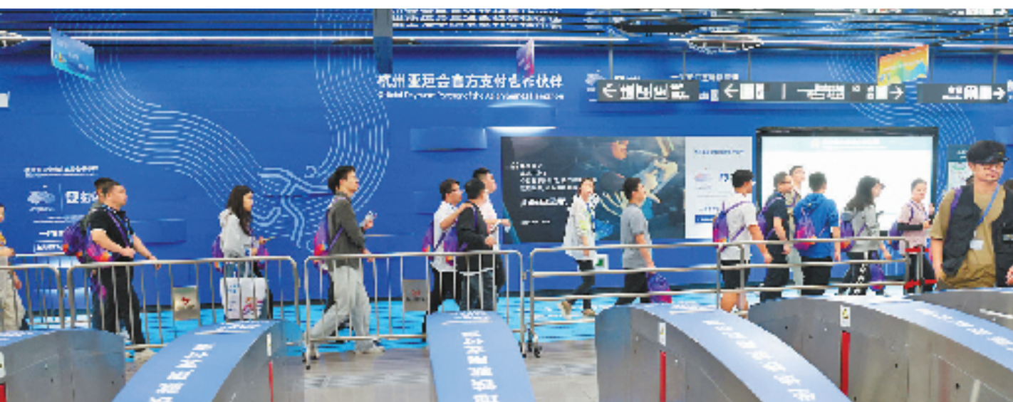
开幕式结束后人流有序疏散。

杭州亚运会开幕式结束那一刻,现场部分观众席旁边的显示器上亮起了绿灯,意味着这一批观众可以有序离场。第一批、第二批、第三批……直至所有观众快速有序离场。