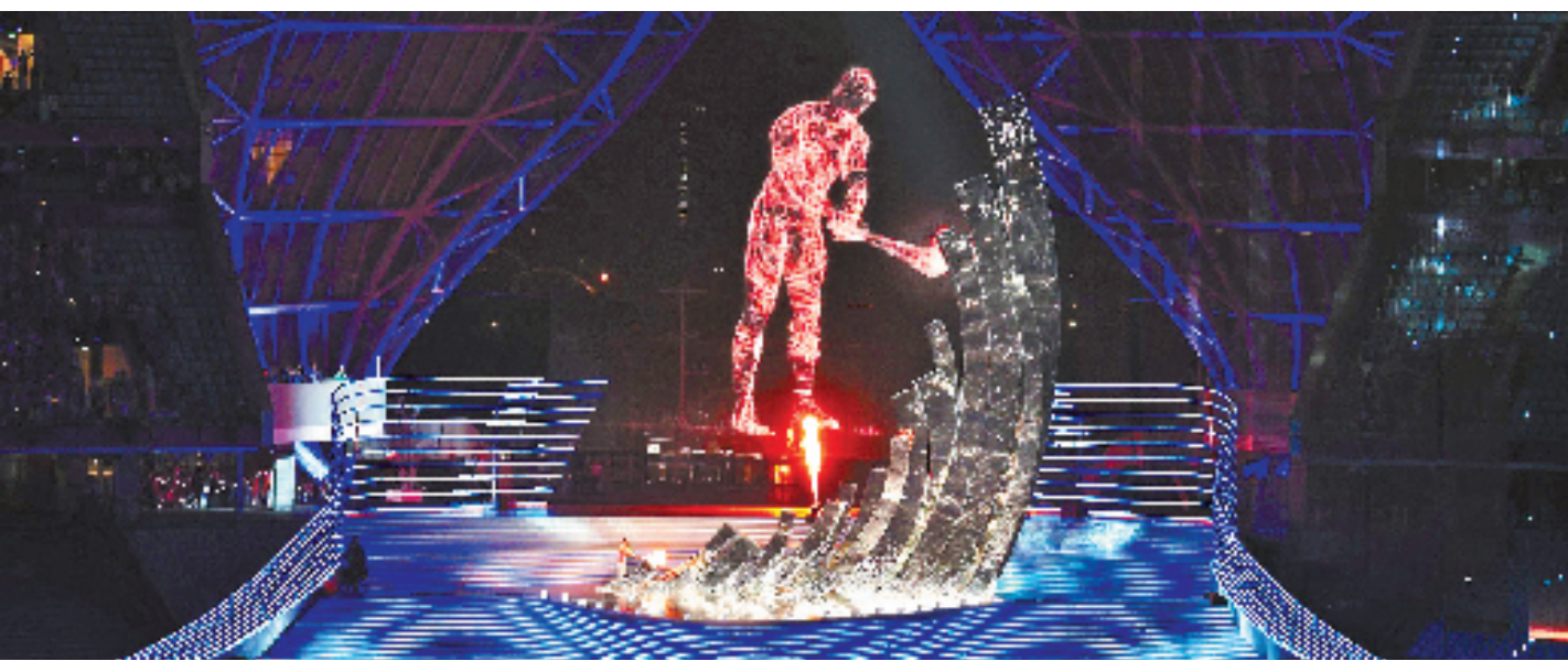
亚运会开幕式上,数字火炬手和运动员火炬手点燃会场火炬。

火炬点燃那一刻,整个开幕式的气氛也推向了最高潮。正如开幕式总导演沙晓岚所说,“这是一种充满自信的表达”,这注定会被亚运历史所铭记——