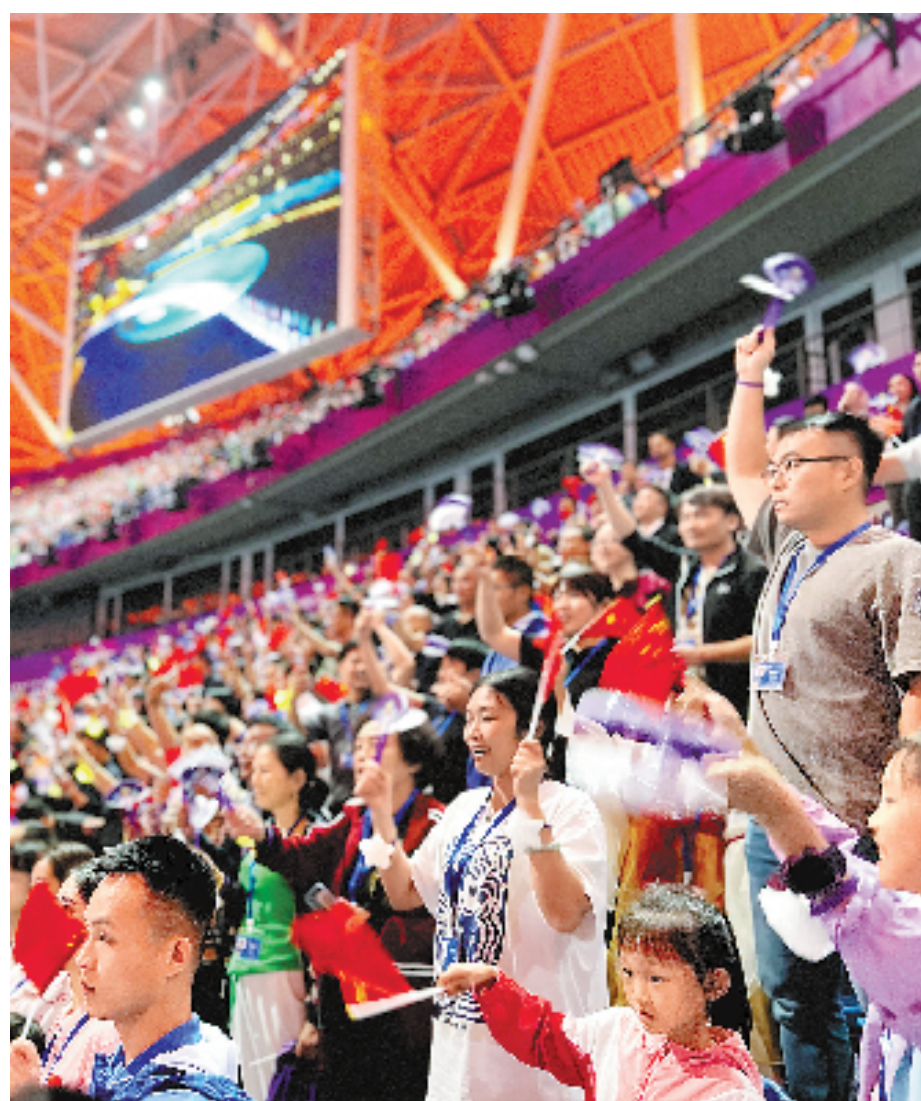
热情的观众

缓缓升起的五星红旗,全场大合唱时感动流泪的女生,阿联酋代表团入场时手中的中国国旗,人类首次上演的数字融合点火……杭州第19届亚运会开幕式上,N个经典瞬间,引爆了现场观众的热情,如潮掌声和欢呼声,一浪赛一浪。