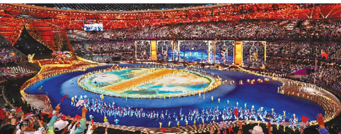
中国代表团在开幕式上入场。