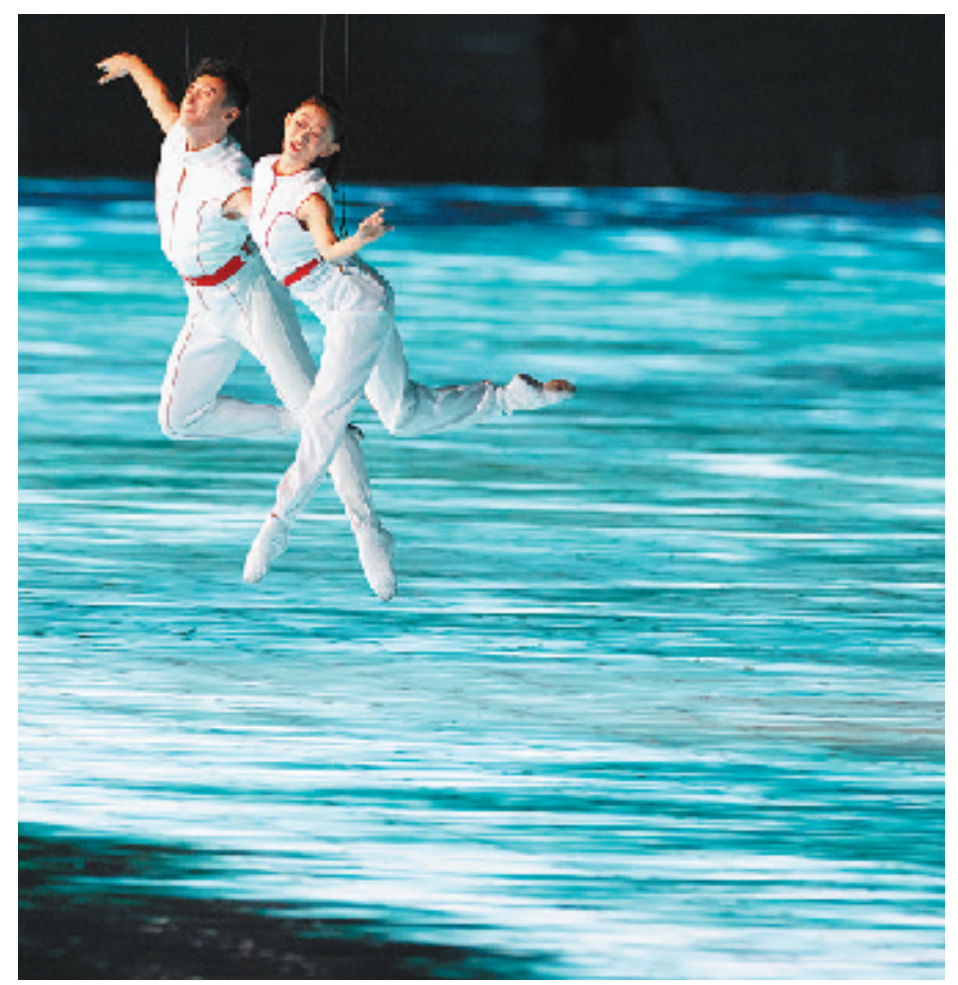
开幕式上的3D双威亚表演。