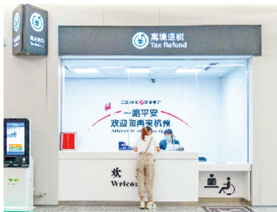
浙商银行杭州分行开办境外旅客购物离境退税代理业务

林立、数量众多，随着亚运会参赛运动员和观赛群众客流增加，支行服务保障压力也随之增大。为做好亚运金融服务保障，浙商银行于9月初便开展了“零钱包”系列金融服务，上万个零钱包投放至各网点，陆续派发给商户，仅东新支行就为超300户商户提供了零钱包兑换服务。此外，东新支行还积极做好电竞馆周边中大银泰城、新天地园区内商户和金融同业的外卡受理、现金服务、移动支付，以及是否有数字人民币标识的巡查工作；并构建充分的保障机制、暖心的服务设施、畅通的服务通道，向亚运会期间境内外人员提供“精细、精准、精致”的全方位金融服务。