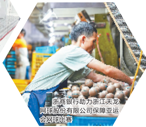
浙商银行助力浙江天龙网球股份有限公司保障亚运会网球比赛