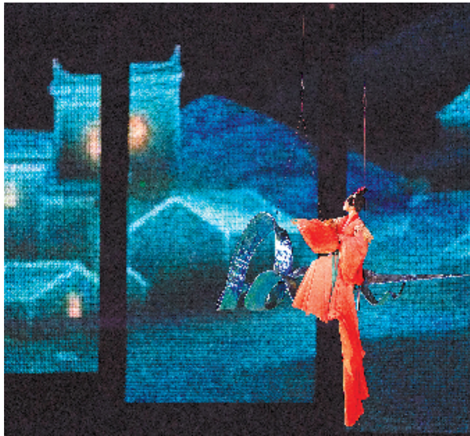
9月23日，演员在杭州亚运会开幕式文艺表演“国风雅韵”篇章进行演出。

亚运“薪火”已经燃起。正如杭州亚运会开幕式主题“潮起亚细亚”所寓意，在国风雅韵中，在钱江潮涌时，让世界触摸我们的根与魂，新时代的中国将携带五千年文明火种，与亚洲、世界一起交融激荡，奔赴未来。