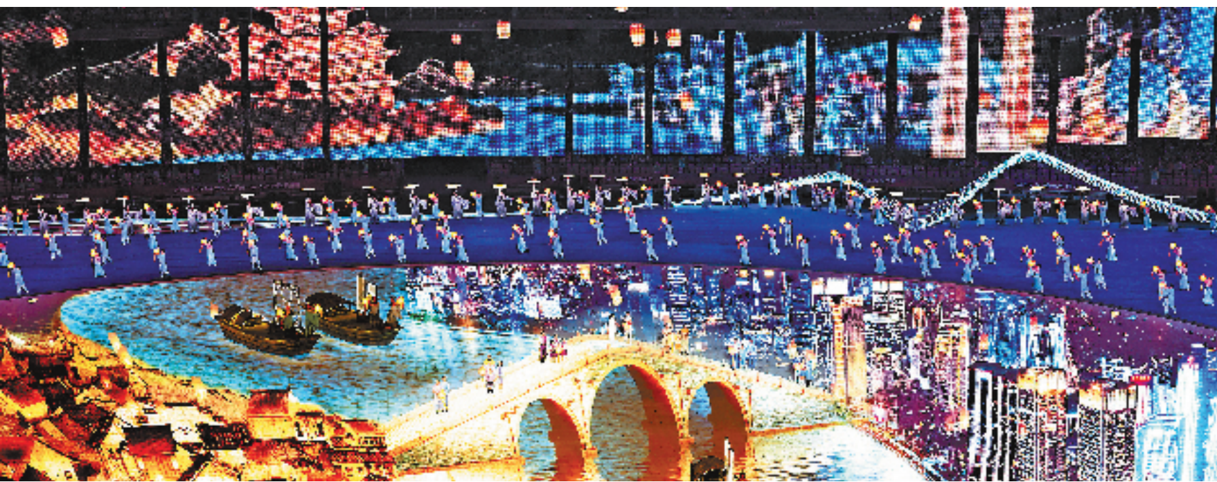
这是9月23日在开幕式上拍摄的演出。