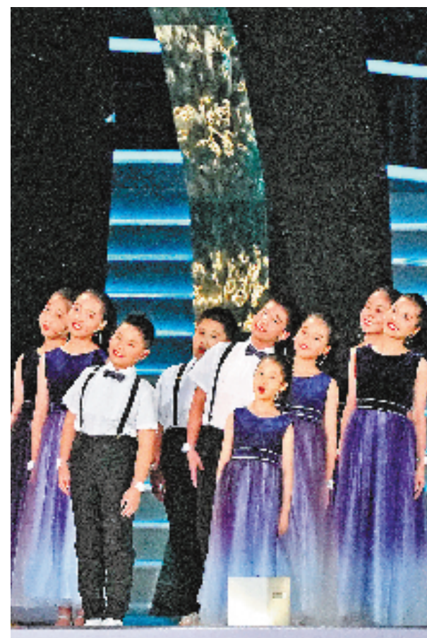
演员在开幕式上表演。