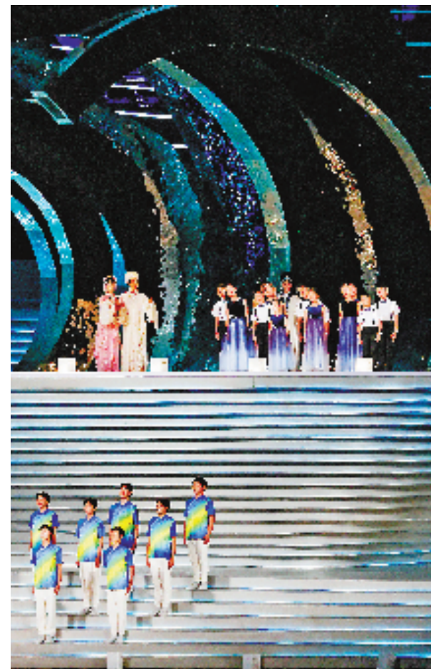
12名孩子(后排)在现场表演。本报记者 姚颖康 摄

“同呼吸同感受同梦想，同爱同在同分享，用拼搏挥洒每一刻，为胜利而欢呼，为勇气而高歌……”