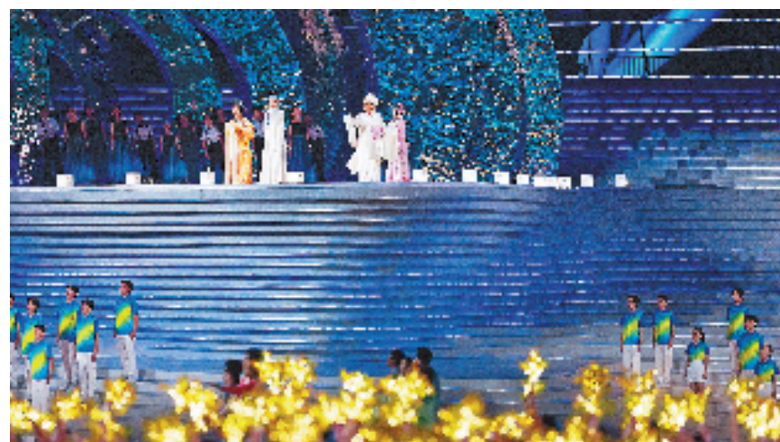
第三篇章《携手同行》中的越剧戏歌表演。