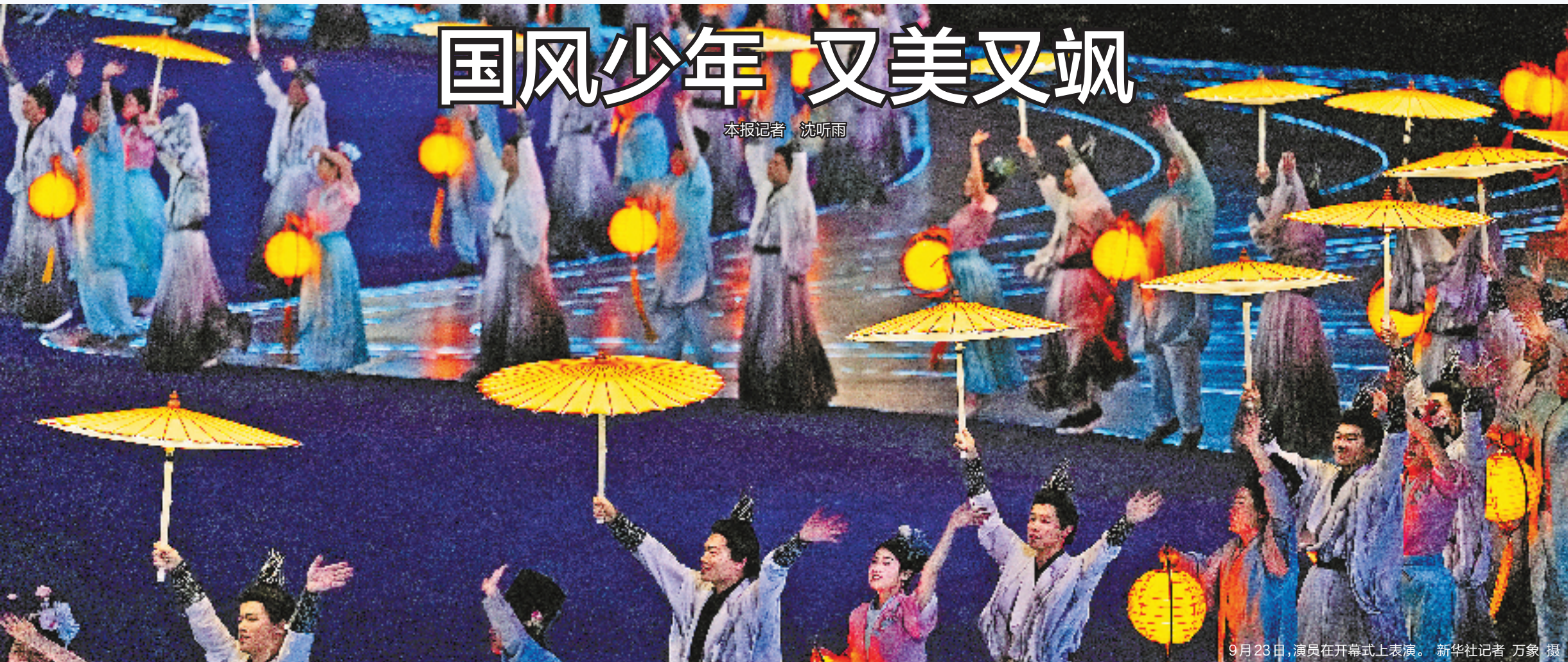
9月23日，演员在开幕式上表演。