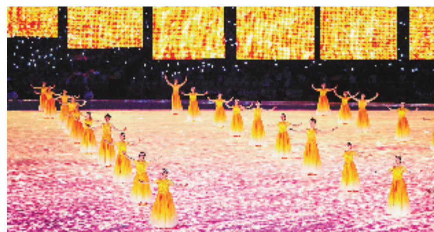
《水润秋晖》呈现良渚秋分之境。

沐浴着秋阳，白鹭稻田相映成趣。良渚先民们驱牛犁地、辛勤劳作，静谧祥和…… “大莲花”巨大的网幕上，先民、耕牛、玉鸟一幕幕闪过，地屏上出现了金黄色的“稻田”，稻穗在秋风中起伏，身着长裙的舞者在“稻田”中起舞，满是丰收的喜悦。 这是亚运会开幕式迎宾表演《水润秋晖》所呈现的良渚“秋分之境”。 5000多年前，良渚先民在长江下游长达3.6万平方公里的土地上建起王国。莫角山侧，文明延绵。以稻作、玉器、土筑、城市建制为特点，良渚以它独特的魅力与厚重的历史，实证了中华五千年的文明史。 2019年，良渚古城遗址申遗成功。2023年6月15日，亚运火种在良渚古城遗址公园成功采集。9月23日，在杭州亚运会开幕式上，良渚古城再次成为焦点。 在中华五千年文明地标上，我们用亘古至今的丰收喜悦，表达东道主杭州迎八方来客的热情欢愉与开放气度。