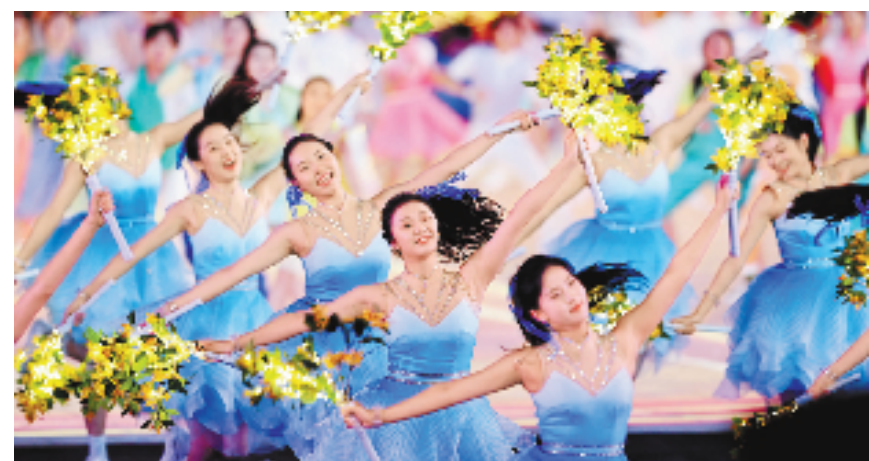
演员在开幕式上表演。

当开幕式主题曲《同爱同在》响起，一朵朵仿真的桂花从“大莲花”上空飘散而来，空气中也弥漫着芬芳的桂花香。 这场期待已久的开幕式，在秋分举办，恰逢杭州金秋飘香的季节。 桂之美，始终贯穿这场绚丽表演。 运动员入场时，演员们奏响“桂花鼓”，以示欢迎。引导员身穿的浅黄色连衣裙，裙摆上是一朵朵精美的桂花刺绣，旗袍式领口盘扣是立体的桂花造型，将引导员们映衬得更加典雅端庄。 为何要在开幕式上使用桂花？ 杭州亚运会开幕式总撰稿冷凇表示，秋天是桂花绽放的季节，桂花又被称作秋日“百花之首”。“蟾宫折桂”的典故在古代比喻学业有成，现在更多指的是体育比赛中运动员摘得桂冠。桂树与冠军在中国文化中紧密相关，人们常用“勇夺桂冠”来表达对胜利者