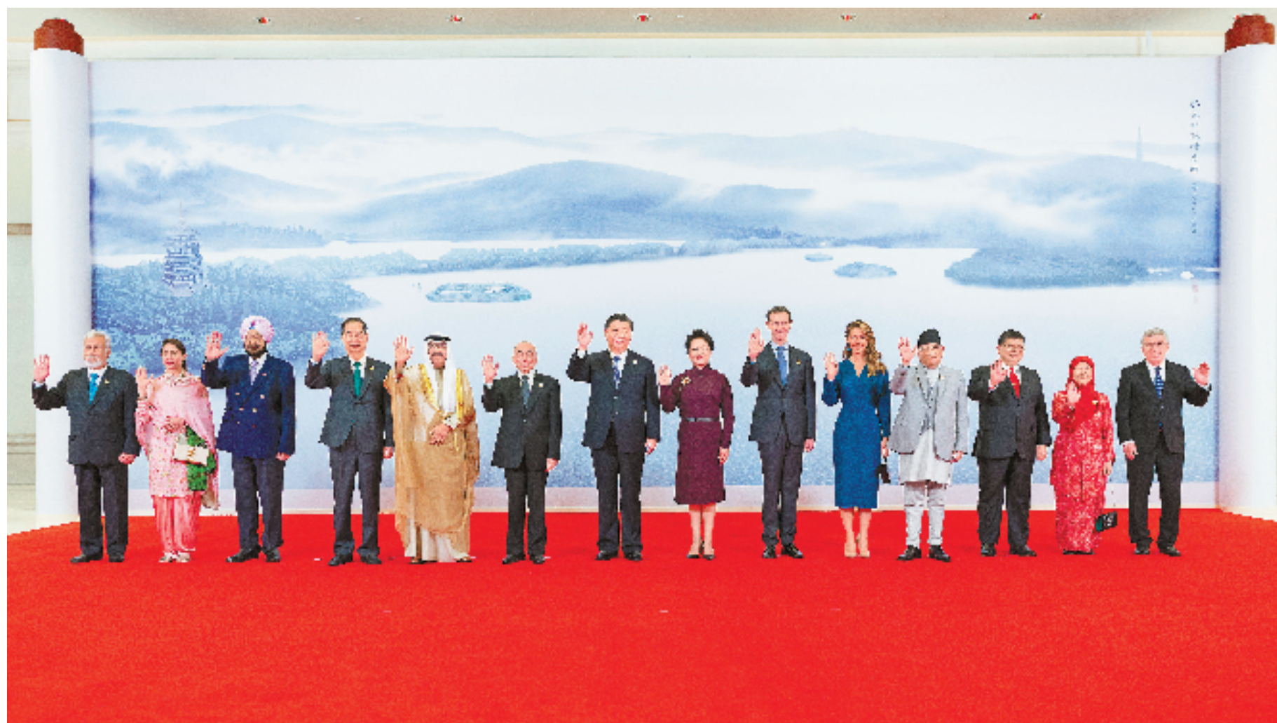
9月23日中午，国家主席习近平和夫人彭丽媛在浙江省杭州市西子宾馆举行宴会，欢迎来华出席杭州第19届亚洲运动会开幕式的国际贵宾。这是习近平和彭丽媛同贵宾们合影留念。

女士们、先生们、朋友们！ 千百年来，杭州以“山水登临之美，人物邑居之繁”享誉世界，被马可·波罗誉为“世界上最美丽华贵之天城”。我曾在浙江工作多年。浙江坚持改革开放，跑出了高质量发展的加速度，正在建设共同富裕示范区，是中国式现