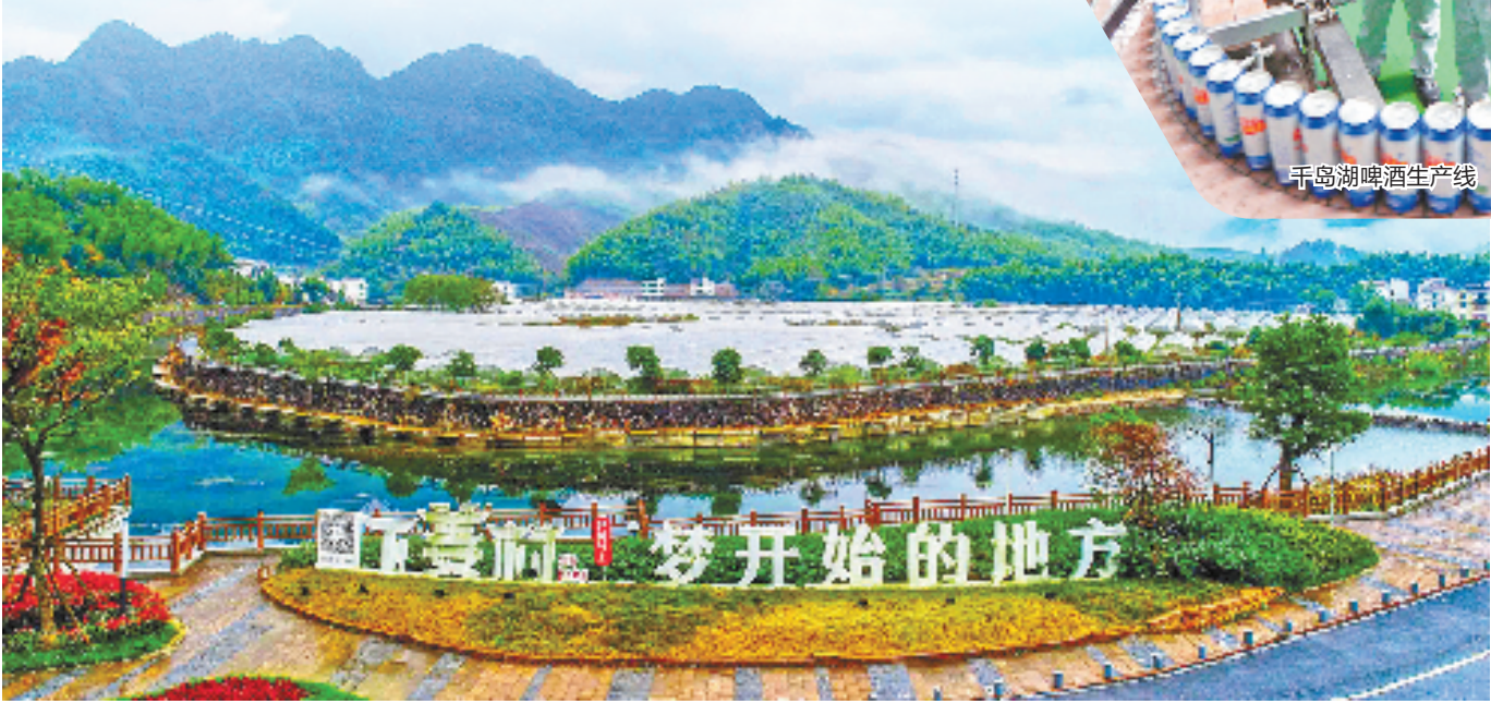
淳安县枫树岭镇下姜村

曾几何时,下姜村的发展,就好像一滴水,折射出全省农村发展的整体状况。面向未来,透过淳安这扇“窗”,能看到的是中国式现代化在山区县的生动实践,更多绿色新动能在此活力迸发。