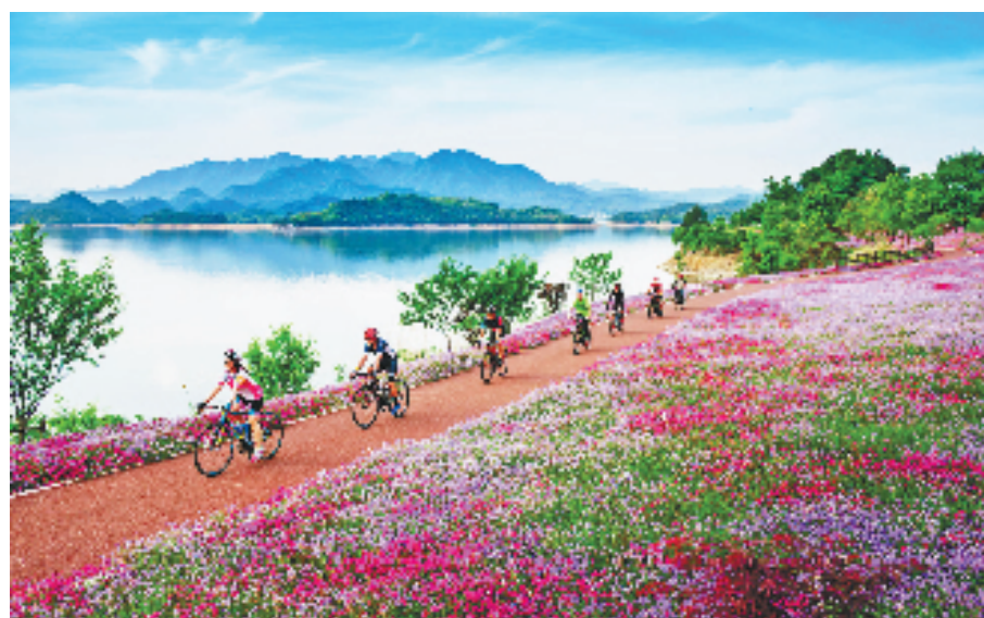
自行车车友在千岛湖骑行

行走在绿水青山间,不难发现,研学、骑行、蹦床乐园等一系列新产品新业态,成为淳安旅游业的新“王牌”。特别是借杭州亚运会的东风,近年来,淳安大力培育山地运动、水上运动、探险运动等体育旅游新业态。