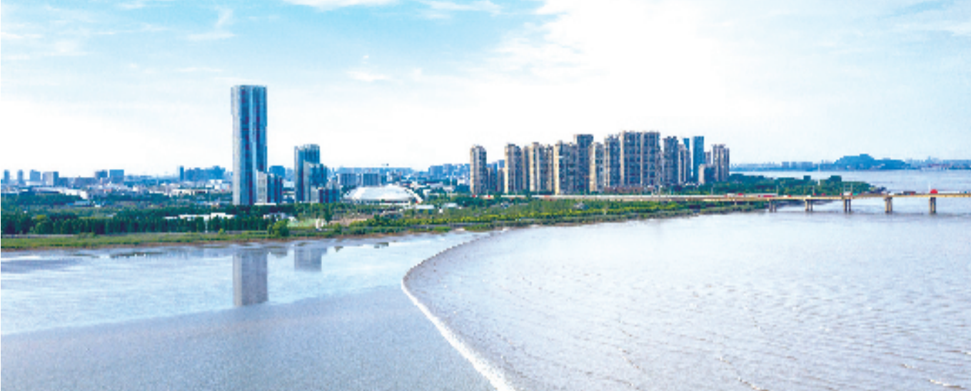
钱塘(新)区景色一瞥