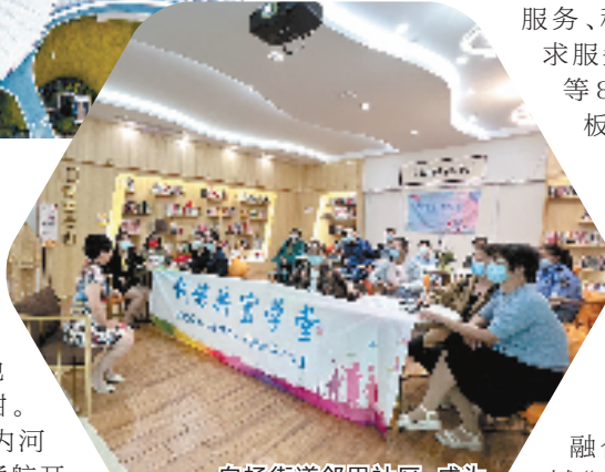
白杨街道邻里社区,成为越来越多新杭州人温馨的家。

“坚持人民至上,我们将抓住亚运机遇,大力推进全域创新、全域智治、全域美丽、全域共富,持续推动经济质效、发展动能、城市能级、民生事业、开放生态、治理能力迭代升级,奋力打造现代化国际化一流新区。”钱塘区委主要负责人说。