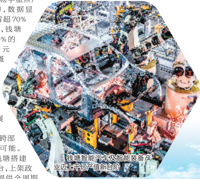
钱塘智能汽车及智能装备产业迈上千亿产值新台阶