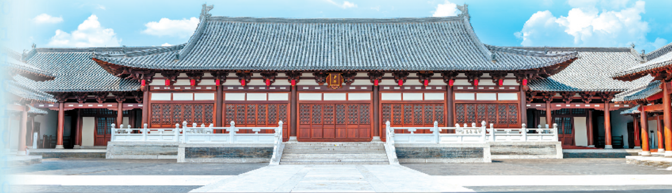
南宋德寿宫遗址博物馆

千年文脉融于当下。在“八八战略”指引下,上城持续放大人文优势,文化繁荣实现历史性提升。今年,杭州提出,要大力推进文化繁荣兴盛,打造别样精彩的新天堂。为此,上城坚持传承保护和创新发展,当好“薪火传人”,讲好“宋韵故事”,打响“人文魅力中心城区”品牌,展现“最杭州、新上城”风采。