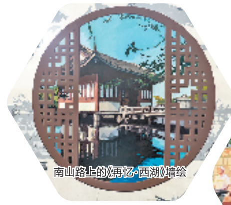
南山路上的《再忆·西湖》墙绘