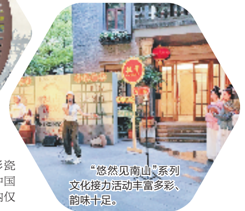
“悠然见南山”系列文化接力活动丰富多彩、韵味十足。

馆藏文物“南宋景德镇窑青白釉兔形瓷塑”为原型,由德寿宫文创团队携手中国民艺先锋品牌联合打造,半月内仅线上平台就售出200多件。