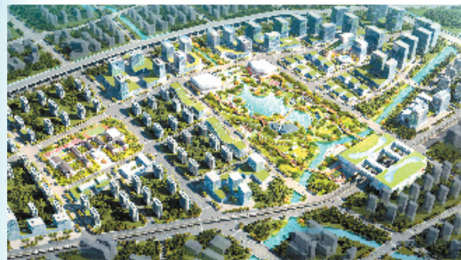
前湾数智城效果图