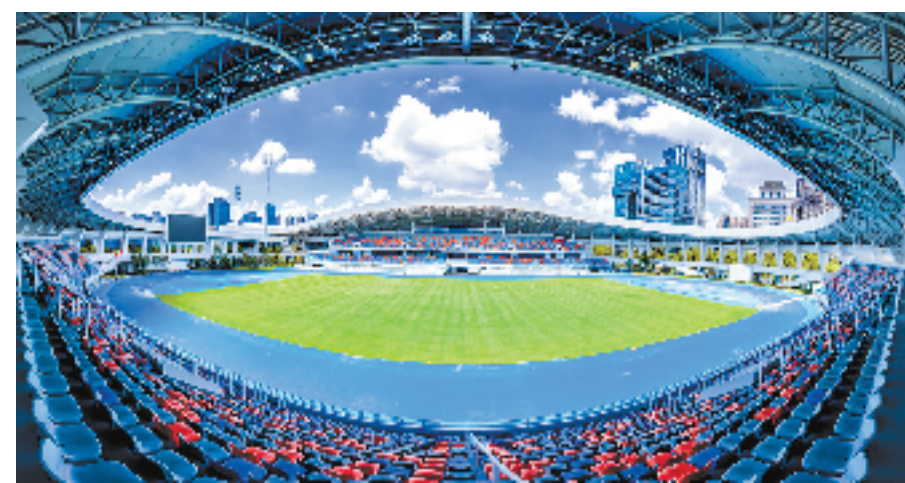
临平体育中心体育场