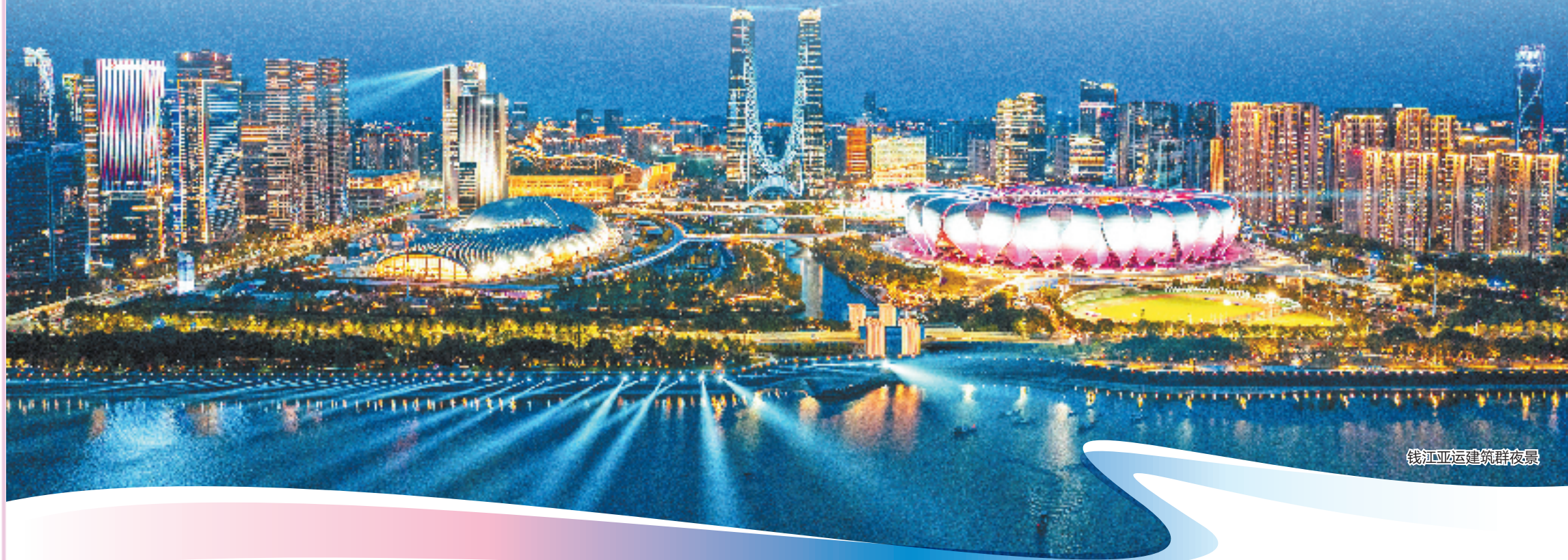
钱江亚运建筑群夜景

明天,世界瞩目的杭州亚运会开幕式即将举办,世界各地的目光将会聚焦在这座越夜越美丽的亚运之城。为了这一天,杭州准备了许多年。