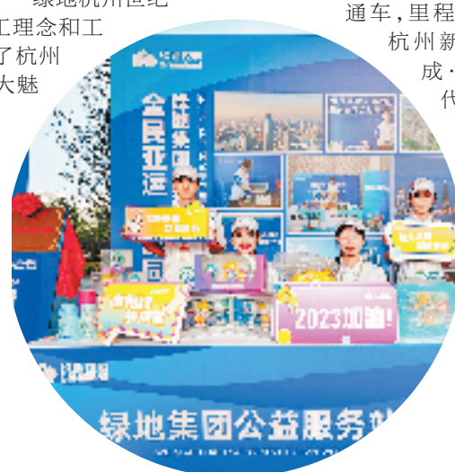
绿地集团公益服务