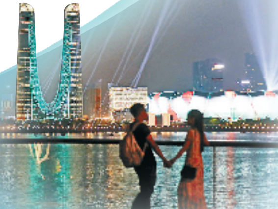
钱塘江夜景图