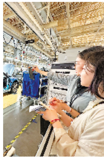
记者在极氪智慧工厂内感受数智制造。