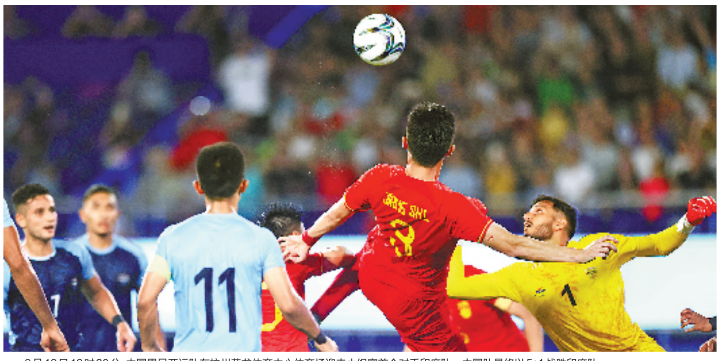
9月19日19时30分,中国男足亚运队在杭州黄龙体育中心体育场迎来小组赛首个对手印度队。中国队最终以5:1战胜印度队。

中国男足亚运队来说,印度队是中国队小组赛遭遇的强劲对手。此役是中国队时隔20多年再度在亚运男足赛场与印度队交锋,2002年釜山亚运会男足小组赛中,中国队曾以2:0战胜印度队。 比赛的气氛,在开赛前两小时就已拉满。17时30分,记者来到黄龙体育中心,见到大量球迷已从四处赶来,其中不少人身着红色球服为中国队助阵。 “等待这场比赛很久了,相信中国队会有很好的表现。”球迷周先生来自苏州,他已经买好了中国队小组赛所有比赛的门票,希望中国队在亚运会取得好成绩。 “我们依然对国足充满信心。”来自金华的球迷胡先生是国足的忠实粉丝,这次,他带着全家人来杭州为中国队呐喊。 现场赶来了一些印度队的球迷。一位印度队的球迷说,中国队很强,不过这几年印度足球的进步也很大,这场比赛,印度队会有机会。 18时30分,黄龙体育中心体育场外已经迎来大批等待入场的球迷,现场随处可见手举指示牌的志愿者。此时,在场内,随着两队球员的进场训练,现场响起一阵阵热烈的掌声。而随着比赛的临近,现场的气氛也越来越热烈。据现场统计,本场比赛观众人数为34588人。 比赛开始,中国男足亚运队对印度队球门发起猛烈攻势,有好几次进攻颇具威胁。第16分钟,中国队获得一个角球机会,高天