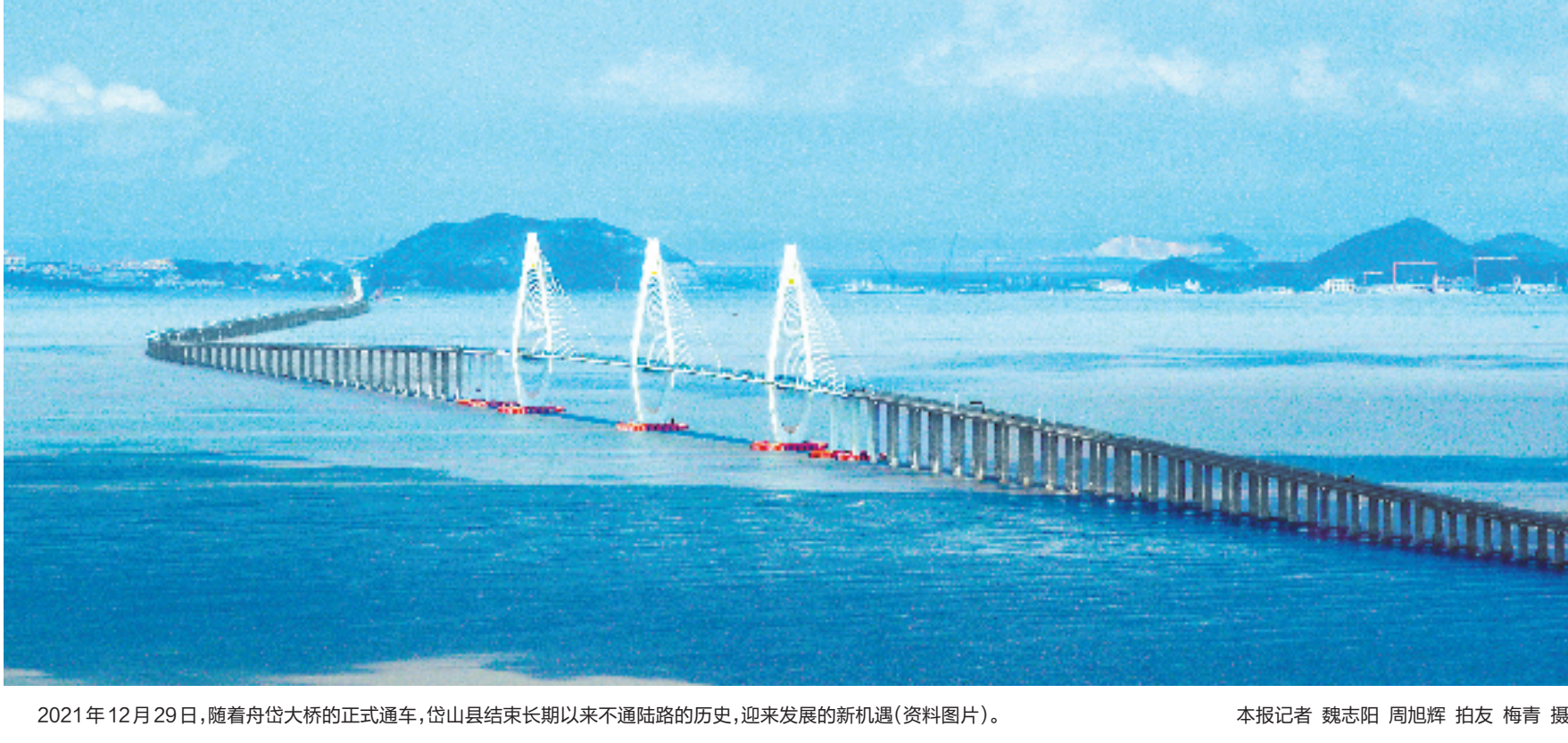
2021年12月29日,随着舟岱大桥的正式通车,岱山县结束长期以来不通陆路的历史,迎来发展的新机遇(资料图片)。

第二,欠发达地区发展不是对发展规律和发展阶段的逾越,而是基于山海资源优势互补、借鉴先发地区发展经验、充分发挥欠发达地区后发优势的整体性提速发展。山和海的资源禀赋差异往往被认为是山海差距的主要原因,但“八八战略”提供了辩证看待山海资源禀赋的视角,强调山海资源优势互补,推动“山海协作”。通过“山海协作”,欠发达地区可以借鉴其他地区发展的成功经验,用好其他地区的资源,发挥本地具有特色的后发优势,用较短时间走完发达地区用较长时间走过的路。立足山海资源优势互补,将山的资源禀赋转化为新时期的发展优势,在加快推进浙江经济高质