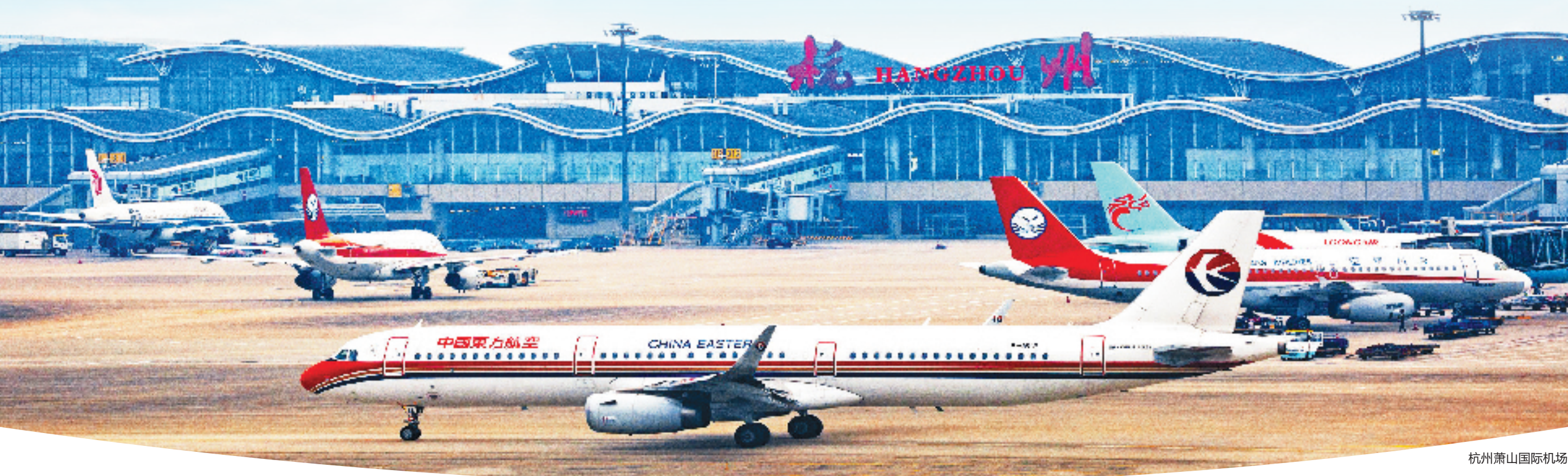
杭州萧山国际机场

日前，杭州美女山下，来自杭州临空经济示范区规划、产业、镇街场驻点负责人围着一张划满红线的地图讨论。他们聚集于此，因为阳城路、美女路和美狮西路交接的这片区域，被划入杭州临空经济示范区企业征迁范围，启动评估、征迁的速度，决定着新项目招引的进度，进而影响经济动能提升的力度——除了冲刺，别无选择。 一个多月前，杭州临空经济示范区企业征迁正式启动，面对萧山有史以来涉及面最广、面积最大、任务最重的一次企业征迁，在产业“进”“退”之间，空间“腾”“挪”之后，临空不仅要为自身发展谋求新高度，更要为实现杭州高质量发展提供强效助力。 “后峰会、亚运会”的发展机遇，将牵引杭州城市能级大提升。临空这场企业征迁，将为杭州从特大城市向超大城市晋档升级塑造一个支点，在“进”“退”之间，腾出发展新高度。