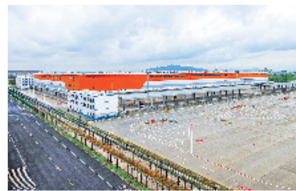
杭州萧山国际机场东区国际货站