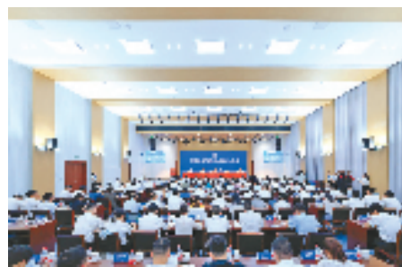
企业征迁动员大会