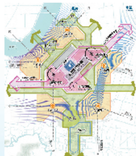
启动区功能结构图