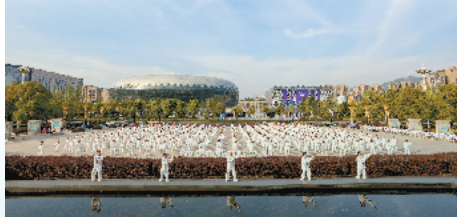
瓜沥镇千人武术展演

在此前的亚运会倒计时30天活动中,瓜沥发出宣言——将全方位、全视角宣传亚运文化、推介城市风貌,引领全镇市民深度参与到家园美化、志愿服务、运行保障中来,以文明有礼、向上向善、共建共享的主人翁姿态,讲好亚运故事、喜迎八方来客,全面呈现“文明古镇、临空重镇、产业强镇”的美好风采。