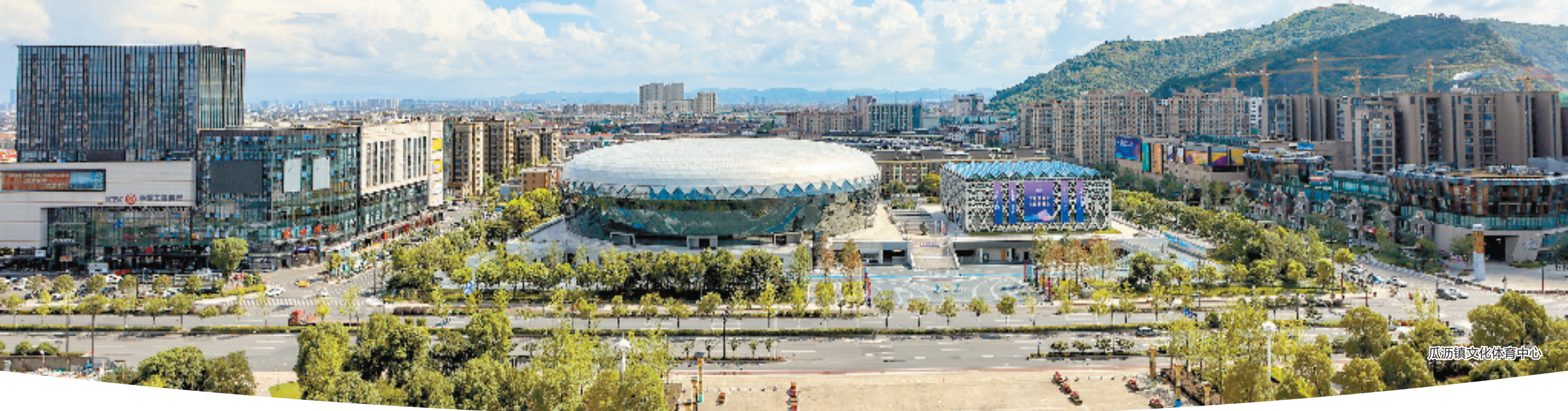
瓜沥镇文化体育中心

一个地区发展的快慢,很大程度上取决于能否把握机遇。对于杭州市萧山区瓜沥镇来说,小城市培育试点是过去的最大历史机遇。仅仅十余年时间,就完成由“镇”到“城”的转身,无论是人口、面积,还是规上工业企业数量、工业用地等,都在萧山具有举足轻重的地位,位列全国高质量发展500强镇第31名。如今,杭州亚运会、亚残运会成了瓜沥新的重大机遇。辖区内的瓜沥文化体育中心,是杭州第19届亚运会56个场馆中仅有的两个设在乡镇的场馆之一,将承办亚运会武术、卡巴迪和亚残运会跆拳道3个项目的比赛。小城办大赛,蕴藏着无限可能。瓜沥镇主要负责人曾多次公开表示:亚运兴镇。亚运,究竟会给瓜沥带来什么?瓜沥,又在为亚运做些什么?