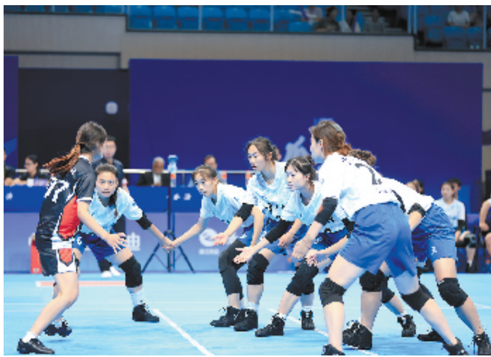
2023年全国卡巴迪冠军赛