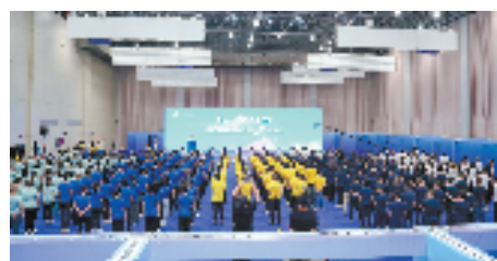
倒计时30天瓜沥誓师大会