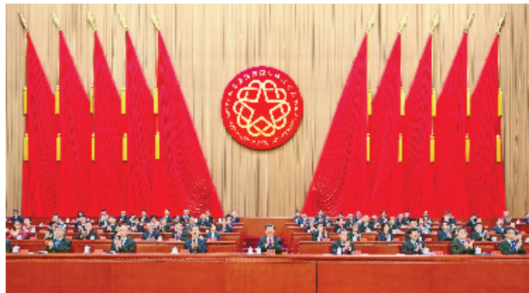
8月31日，第十一次全国归侨侨眷代表大会在北京人民大会堂开幕。习近平、李强、赵乐际、王沪宁、蔡奇、丁薛祥、李希、韩正等在主席台就座，祝贺大会召开。