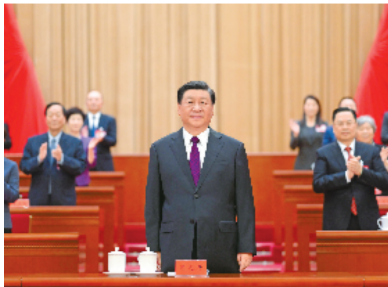
8月31日，第十一次全国归侨侨眷代表大会在北京人民大会堂开幕。这是中共中央总书记、国家主席、中央军委主席习近平在主席台向与会代表致意。