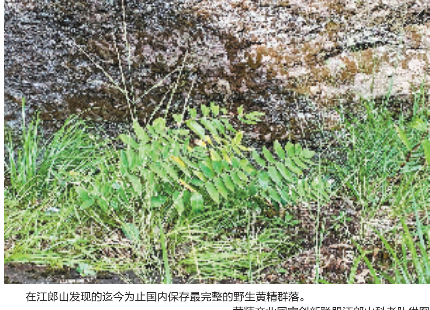
在江郎山发现的迄今为止国内保存最完整的野生黄精群落。