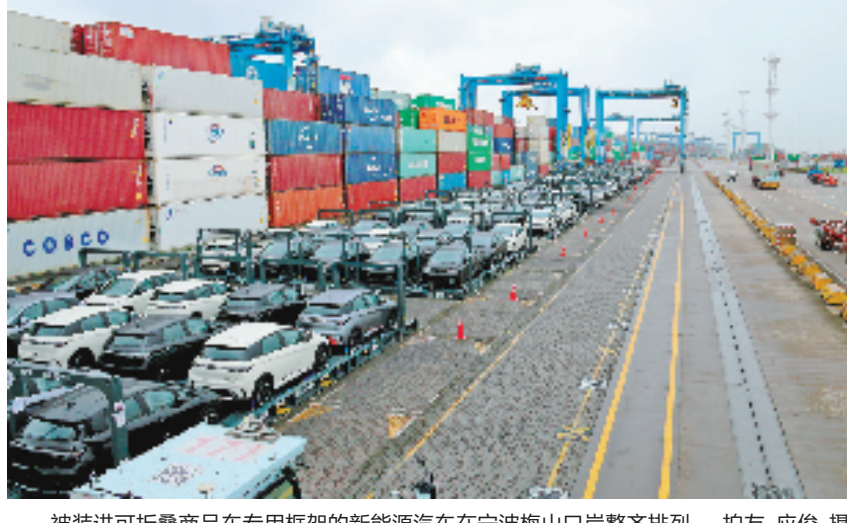
被装进可折叠商品车专用框架的新能源汽车在宁波梅山口岸整齐排列。

据悉,可折叠商品车专用框架,是中远海运结合整车主流尺寸和运输特点专门研发的,每个框架长约14.6米,可以平铺装载3台整车,而且还可层叠堆放,适用的船型较多。以此次挚诚轮为例,去程运载出口商品车,回程以运输纸浆为主,双向货源为稳定的海运服务提供有