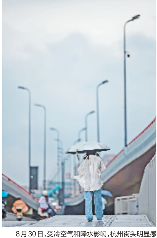
8月30日,受冷空气和降水影响,杭州街头明显感受到了“秋凉”。

台风影响下,浙南和浙东地区的防潮压力增大。台风影响期间(8月30日至9月3日),我省沿海海口正值天文大潮汛,据省水文管理中心预报受9号台